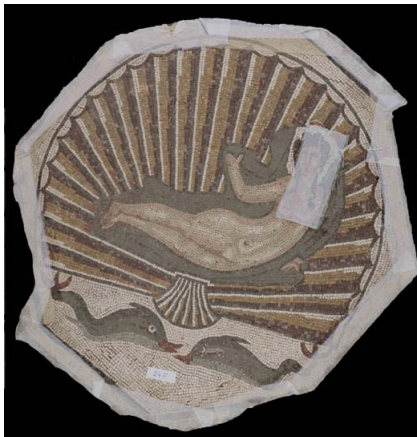
fig. 1. Mosaico del Nacimiento de Venus.

El llamado mosaico del Nacimiento de Venus (Fig. 1), descubierto en el yacimiento arqueológico de la ciudad romana de Cartima (Cártama, Málaga) está fechado en el siglo II d.C (Balil, 1981).