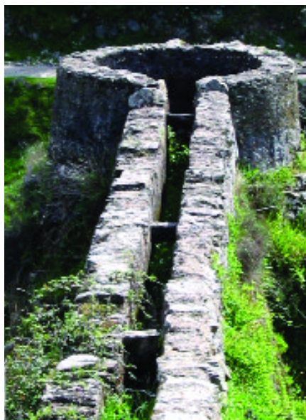
Molino de Rodezno. Arroyomolinos de León (Huelva)

Antropólogo. Delegación Provincial de Cultura de Huelva