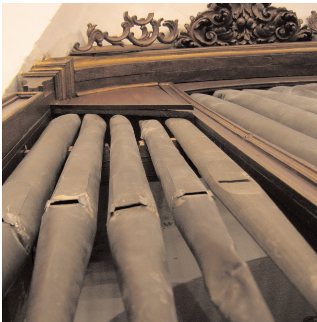
LÁM. Nº 5. Tubería de la fachada de la izquierda, donde se observa el primer tubo de la derecha realizado en madera.