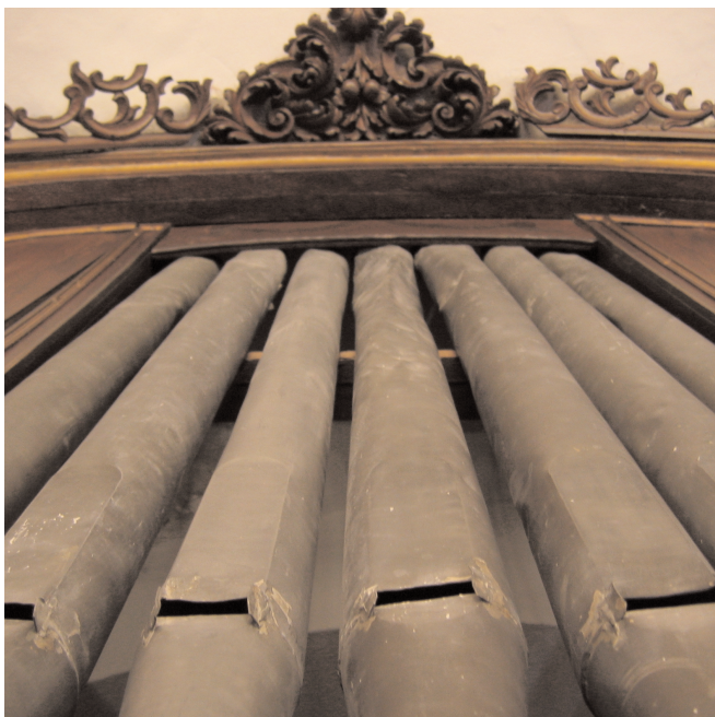
LÁM. Nº 6. Tubería central y remate.