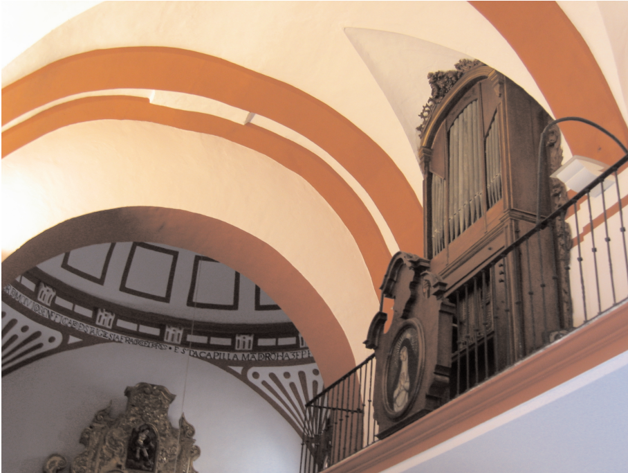
LÁM. Nº 2. Vista general de la tribuna del órgano.

En resumen, el desaparecido conjunto coral de la iglesia parroquial de San Juan Bautista, contaba con todos sus elementos característicos, con la salvedad de que nunca llegó a tener sillería, sino una serie de escaños, al igual que en un primer momento tuvieron otras parroquias ecijanas como Santa María o Santa Bárbara. Seguía en su construcción las reglas generales establecidas para este tipo de obras: su forma era rectangular, rodeado por un muro de tres varas de alto, contando con puertas laterales; desde la nave central se accedía al coro a través de la crujía que desembocaba en la reja, que debió de ser de bellas proporciones, formada por balaustres que portaban celosías, cornisas y un friso con la historia de San Juan. Se ubicaba en el penúltimo tramo de la nave central, dejando tras de sí un pasillo de comunicación entre las naves laterales, situándose a los pies de la nave y sobre una tribuna, el órgano. (LÁM. Nº 2).