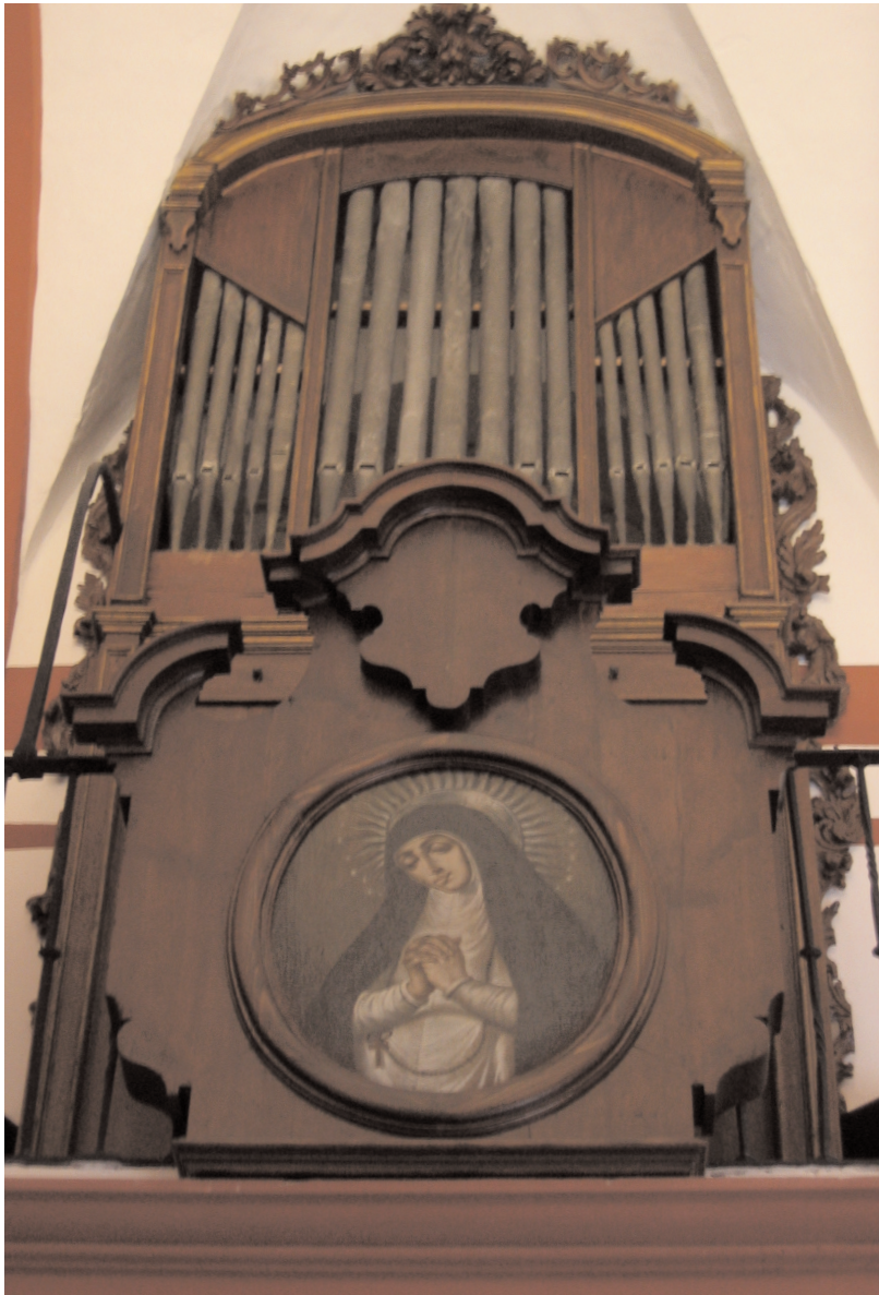
LÁM. Nº 1. Órgano de la Iglesia parroquial de San Juan Bautista de Écija. Fotografías: Antonio Martín Pradas (AMP), diciembre de 2006.