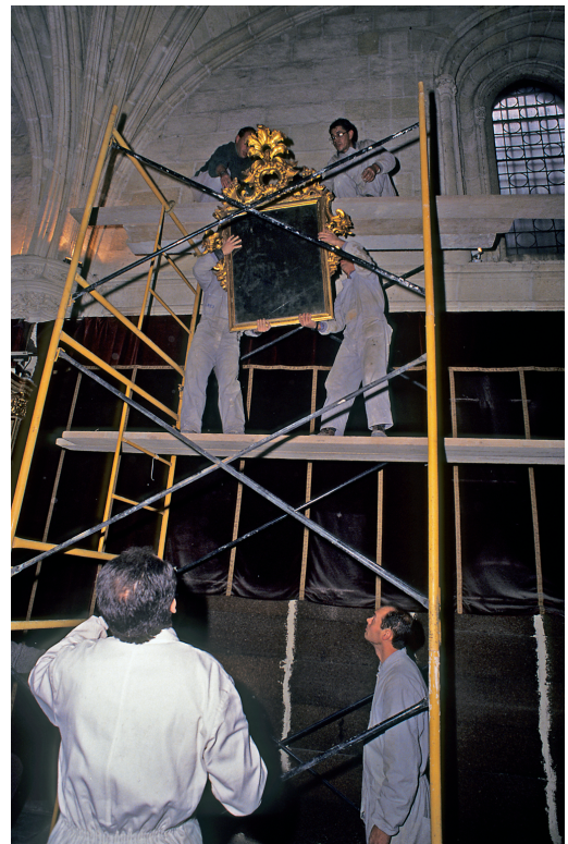
2. Proceso de desmontaje. Capilla Real, Granada. IAPH