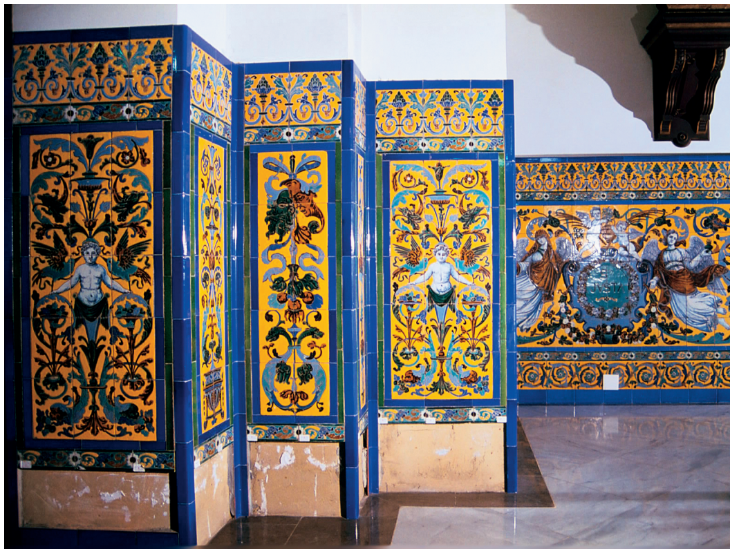
7. Zócalo de azulejos (Fábrica del Hijo de José Mensaque Vera, 1894). Convento de los Padres Capuchinos, Sevilla. IAPH

En cuanto al equipo fotográfico utilizado, no existía unos requisitos mínimos aplicados a las imágenes, e incluso no existían normas o criterios relacionados con conceptos básicos de la imagen como pudieran ser iluminación, uso de películas de distintas características, etc., e incluso no se aplicaban diferentes normas a la hora de tratar gráficamente diversas tipologías patrimoniales.