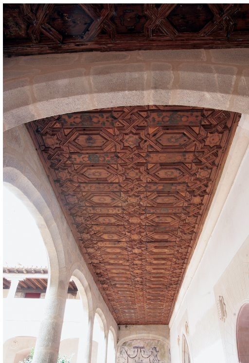
4. Armadura (Anónimo andaluz, 1501-1550). Convento de Santa Clara. Belalcázar, Córdoba.

inventario por parte de las universidades andaluzas. Hasta ese momento los equipos se desentendían del trabajo una vez entregada las pertinentes copias en el Ministerio. Con la entrada del IAPH se establecieron diferentes etapas en la realización del trabajo, prolongando más allá de esta simple entrega el final de la labor. De esta forma una vez entregada la documentación al, los diversos profesionales del Centro de Documentación comenzaban con la revisión de los trabajos para analizar su adecuación a los criterios previamente aceptados por los diferentes equipos de la universidad. Se conseguía así que el trabajo no quedara simplemente archivado, pues en no pocos casos los equipos de campo debían retomar su trabajo para corregir y homogeneizar la información. El proceso no fue fácil de imponer pues requería una mayor dedicación, aunque con el tiempo fue asimilado por los diferentes equipos rebajándose, casi en cada entrega, las correcciones necesarias.