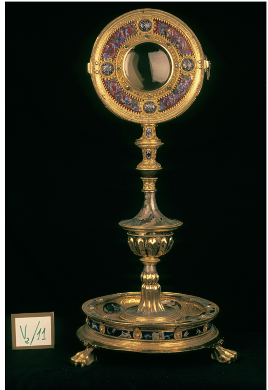
1. Proceso de catalogación de pieza de orfebrería. Capilla Real, Granada.

Una de las claves del desarrollo del Inventario de Bienes Muebles de la Iglesia Católica en Andalucía fue plantear un ciclo de trabajo que no concluía con la entrega del