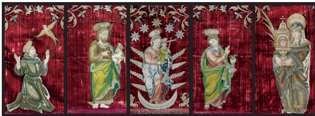
8. Frontal de altar (Anónimo andaluz, 1501-1550). Convento de Santa Clara. Belalcázar, Córdoba.

El primer cambio de criterio se produce a finales de 1993 y principios de 1994, justo cuando el área de patrimonio mueble del Centro de Documentación se hace cargo del seguimiento y validación del inventario. Del soporte fotografía se pasa a diapositivas de 35 mm, y se inicia el proceso de digitalización de ese material en formato GIF, por entonces el más cualificado. Contar con un documento digital de cada uno de los bienes posibilitó que a través de la base de datos se pudiese asociar la imagen a cada uno de los registros textuales. Cada equipo de inventario debía entregar original y tres copias de cada imagen.