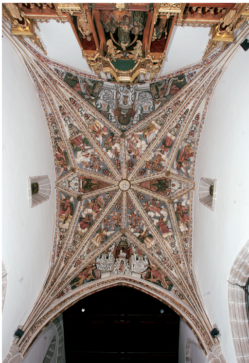
3. Pinturas murales (Anónimo cordobés, 1701-1750). Iglesia Parroquial de San Juan Bautista. Hinojosa del Duque, Córdoba.