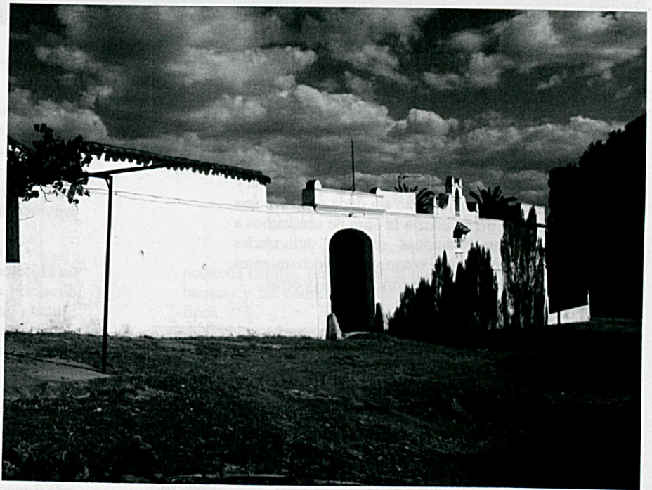
Cortijo Los Partidos

Quizás no encontremos un ejemplo tan valioso a la hora de analizar y comprender el proceso de transformación de la sociedad extremeña, como el que nos deja entrever la historia de los cortijos que inundan los campos de esta comunidad autónoma. El tejido socioeconómico creado alrededor de los cortijos, verdaderos núcleos