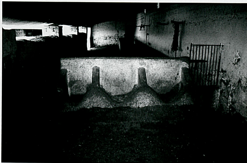
Segundo patio o corralón

Desde ese patio que describimos ahora, se accede a la escalera que nos lleva a la segunda planta, conocida también como doblar , al resto de dependencias auxiliares con las que cuenta esta unidad agropecuaria, o a la