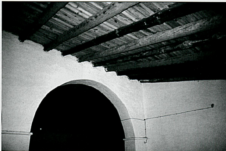
Segunda planta o doblao

Dividida en cuatro dependencias, al entrar en la casa del guarda lo primero que nos encontramos es la cocina presidida por una gran chimenea, además de una pila para fregar los platos y una alacena. Además de este espacio, nos encontramos con un cuarto de baño, un salón comedor de escasas dimensiones, y un dormitorio. Podemos destacar de