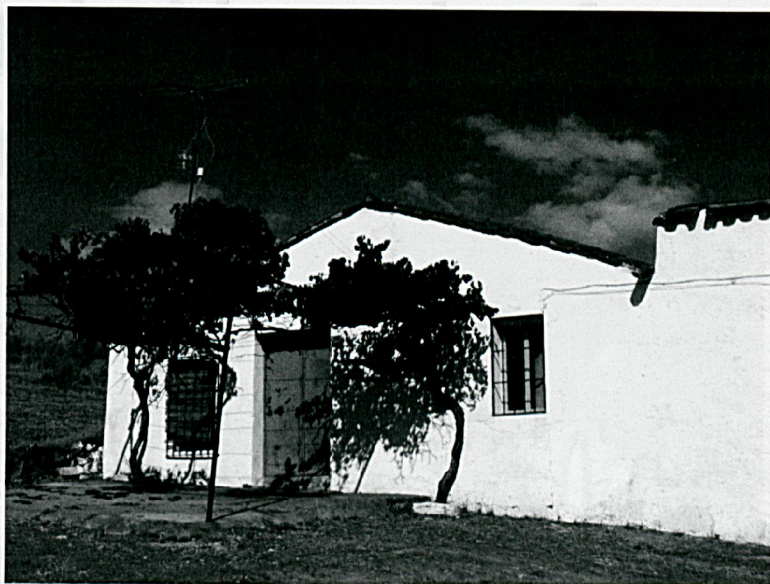
Casa del guarda

Hace unos años que el guarda de la finca (última persona que vivió permanentemente en este lugar) se jubiló y se trasladó al pueblo, aunque nos comentaba en una entrevista que los últimos años de trabajo, tan solo iba al cortijo a trabajar y que cuando terminaba la faena, volvía a su casa del pueblo.