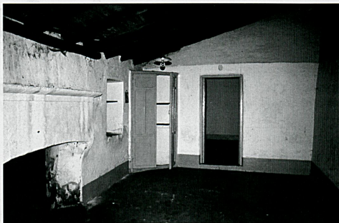
Interior de la casa principal del cortijo

Determinar la importancia de este tipo de construcciones dentro del contexto en el cual se crearon y sus transformaciones, nos acercan sin duda alguna a una información de enorme validez a la hora de acercarnos a aspectos tales como relaciones sociales, actividades económicas, relaciones con el entorno, aprovechamientos agroganaderos, características arquitectónicas y otras.