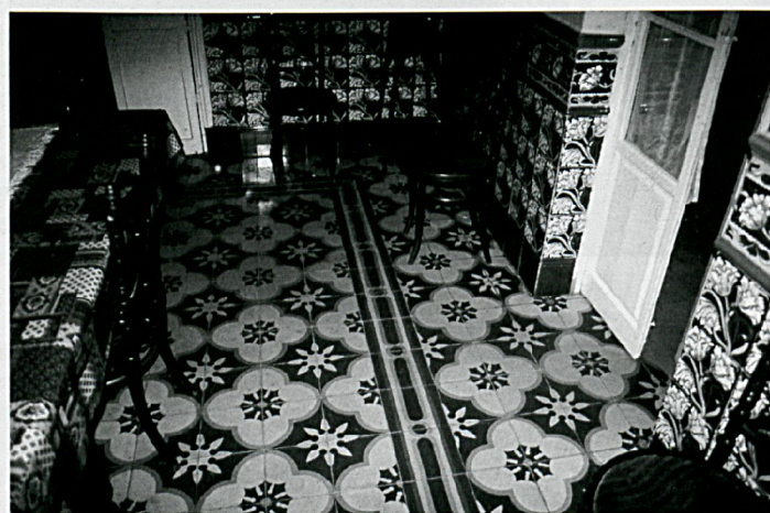
Interior de la casa principal del cortijo

La fachada cuenta con un patio anterior cerrado en el que destacan las palmeras y el pequeño