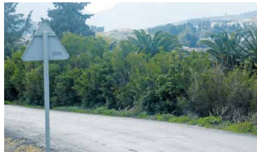
El camino de las Algaidas en la Vega. En segundo término, túmulo de Menga