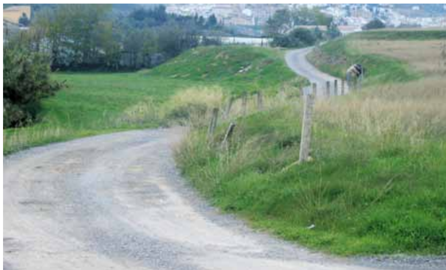
Camino junto al río de la Villa, antes de su entrada en la vega

Recorrido n.º 2: puerta de Granada-río de la Villa