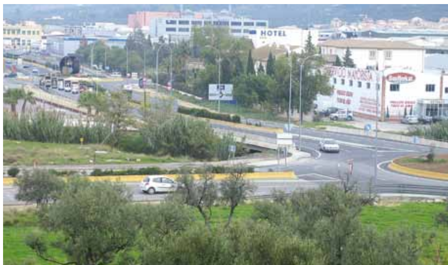
Entrada del río de la Villa en la vega de Antequera