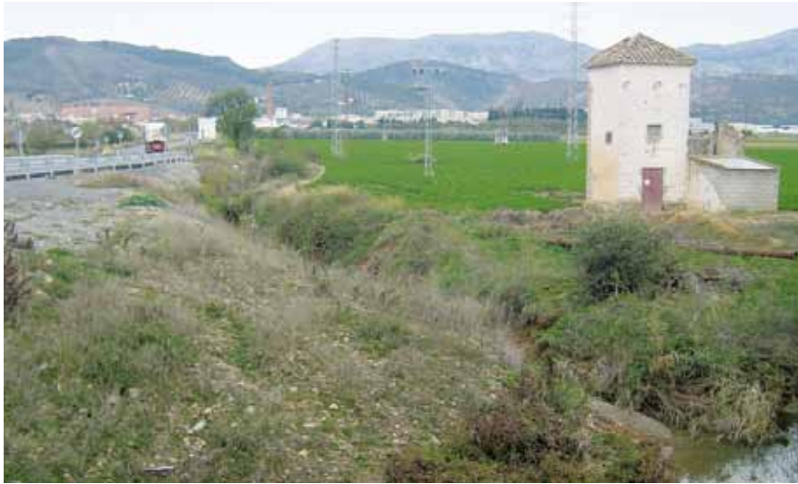
Desembocadura del arroyo de Romeral en el arroyo de las Adelfas

Recorrido n.º 4: arroyo de Romeral-camino de los Cipreses