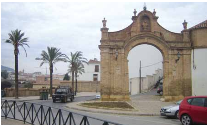
Puerta de Granada