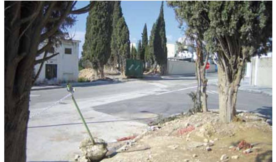
Interrupción del tramo inicial del camino de los Cipreses