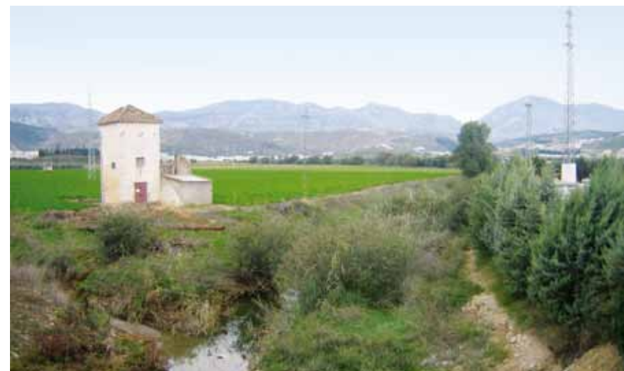
Vista desde la desembocadura del arroyo de Romeral