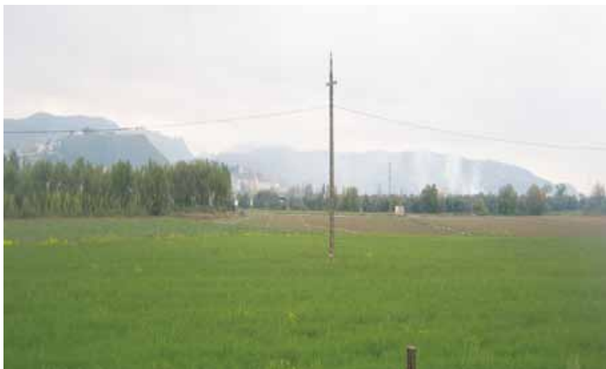
Arroyo de las Adelfas, desde las cercanías del arroyo de Romeral

Recorrido n.º 5: polígono-arroyo de las Adelfas