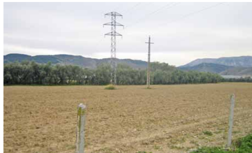
Arroyo de las Adelfas, desde el camino de las Algaidas.