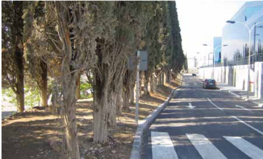
Tramo inicial del camino de los Cipreses

Recorrido n.º 3: puente sobre el río de la Villa-tholos del Romeral