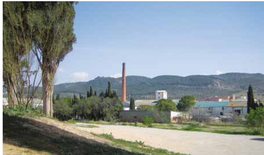
Chimenea de la azucarera, desde el tholos de Romeral