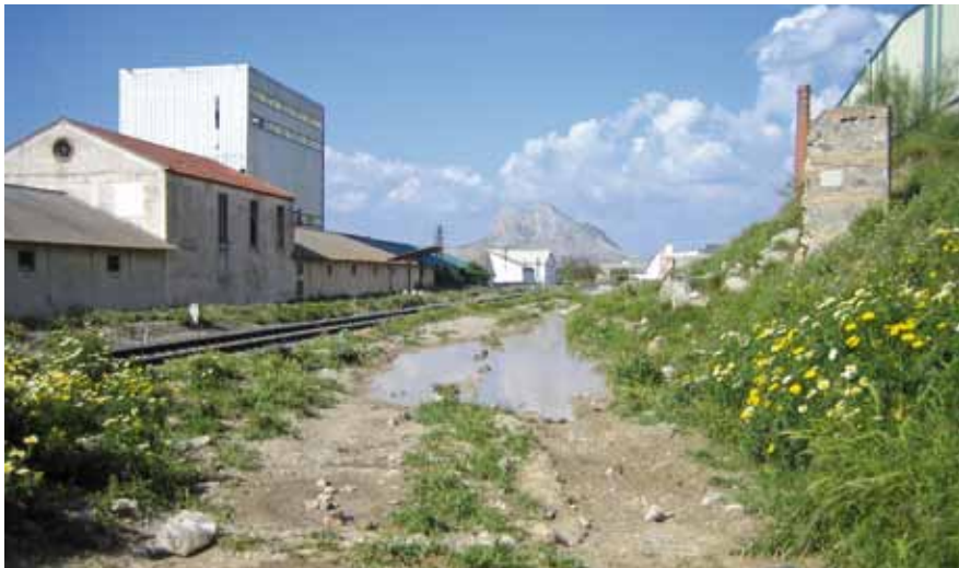
F.C. Sevilla-Granada, en el tramo final del recorrido (SO-NE)