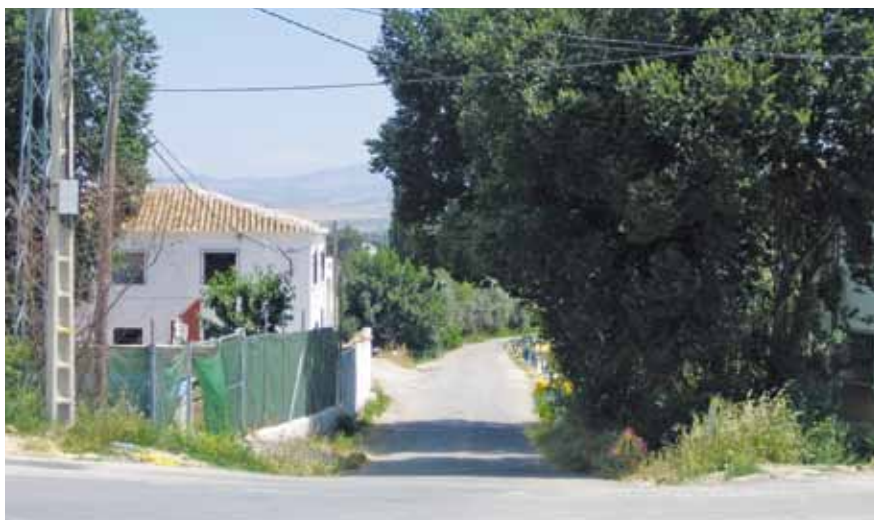
Entrada a la vega por el camino de las Algaidas