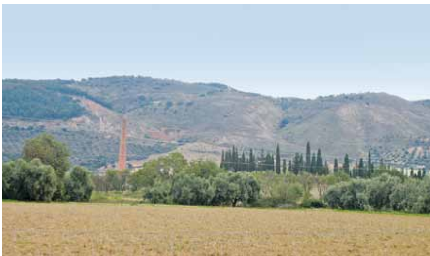
Arroyo de las Adelfas, colina de Romeral y chimenea de la azucarera