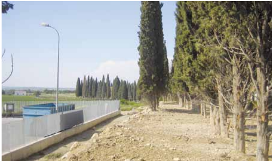
Tramo final del camino de los Cipreses