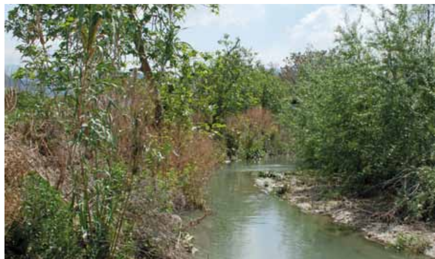
El río de la Villa en la vega de Antequera, desde el camino de las Algaidas