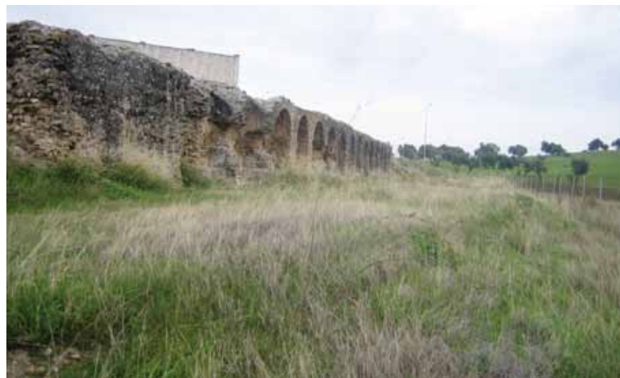
Carnicería de los Moros