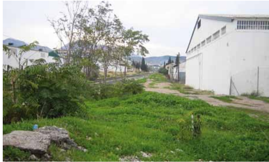
F.C. Sevilla-Granada, en el tramo final del recorrido (NE-SO)