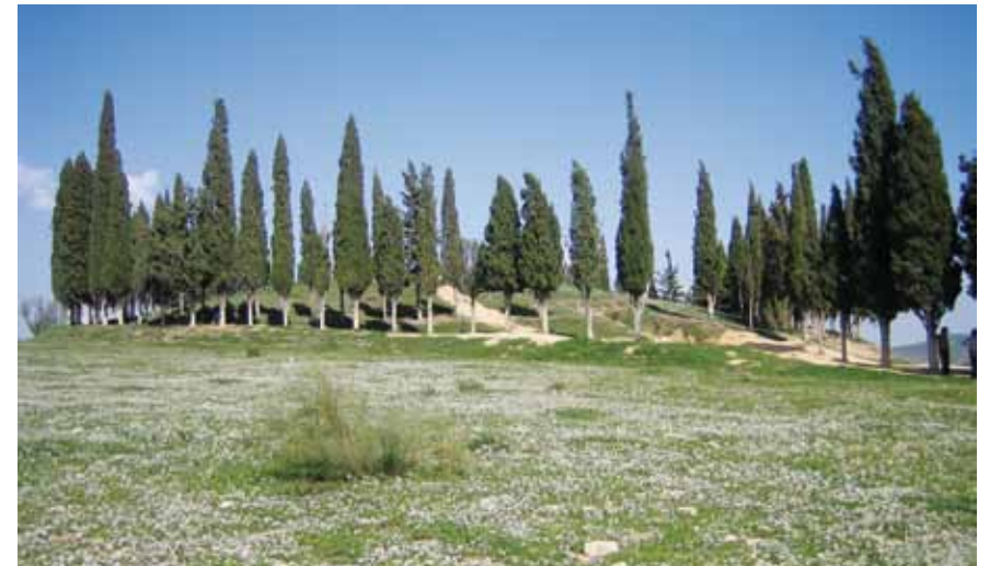
Tholos de Romeral