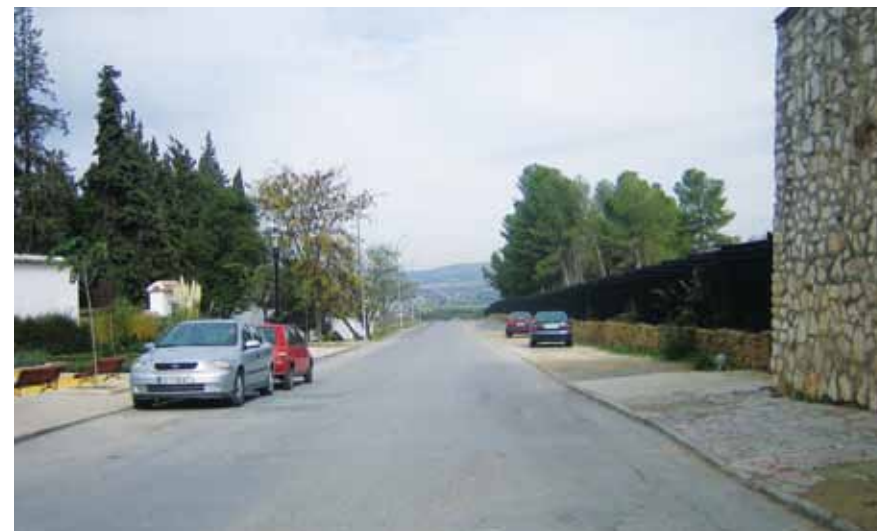
Camino del cementerio