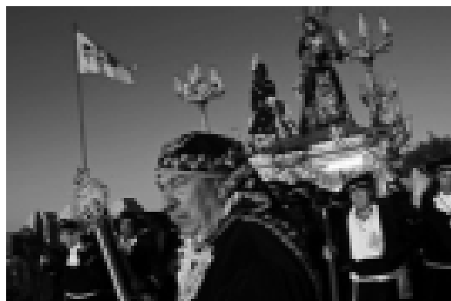
Correr la Vega. Semana Santa de Antequera.