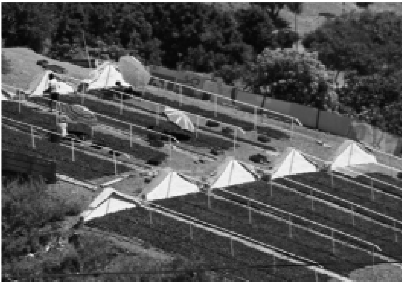
Paseros (Axarquía).

La barca de jábega, a pesar de haber perdido su función principal, embarcación para pescar con el copo o jábega, como todo lo que necesita ser perpetuado por ser un referente identitario para un grupo social, se ha resignificado. Actualmente sigue usándose para regatas y para portar a la marinera Virgen del Carmen en sus aguas mediterráneas. Dentro de este