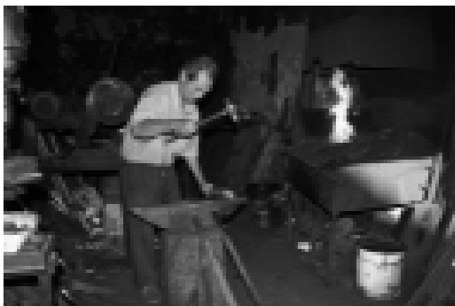
Herrería en Gaucín. Serranía de Ronda.

De los 650 rituales festivos registrados en el Atlas, 111 son de la provincia de Málaga y representan diferentes tipologías distribuidas a lo largo del ciclo anual, siendo las más comunes las Cabalgatas de Reyes Magos, las Candelarias, Carnavales, Romerías,