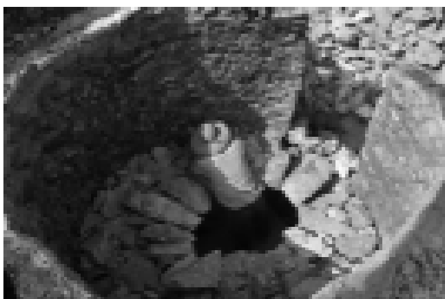
Producción de Cal en Competa (Axarquía).