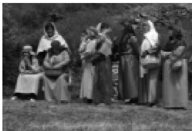
El Paso de Cajiz Fondo Gráfico IAPH.

Cruces de Mayo, Ferias, Semana Santa, Corpus Christi, o Santos Inocentes, procesiones cívico-religiosas en honor a diversos santos, relacionados con diferentes momentos del ciclo productivo agrícola, ganadero o pesquero de las respectivas comarcas (San Antón, San Sebastián, San Juan, Virgen del Carmen, ...). Las fiestas de Moros y Cristianos se extienden fundamentalmente por las provincias de Almería, Granada y Jaén. No obstante, hasta el momento, en Málaga se han registrado también algunos ejemplos como los de los municipios de Alfarnate, Benalauria y Benadalid.