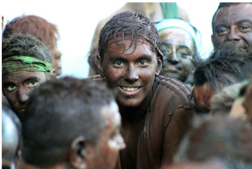
FIESTA DEL CASCAMORRAS. GUADIX GRANADA.

y por todos los medios posibles (jornadas, congresos, ponencias, encuentros, seminarios, cursos, presentaciones, videos, radiodifusión, radiotelevisión, publicaciones en prensa, redes sociales, entre otros).