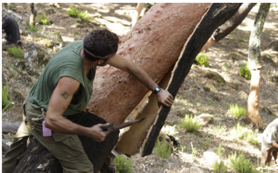
SACA DE CORCHO.

Las fases del trabajo para la realización de un proyecto de documentación deben trazarse de acuerdo con los objetivos y criterios metodológicos que se emplearán. En el caso del APIA, durante el año 2008, comenzó la preparación de las fases sucesivas de trabajo de campo que se iniciaron en