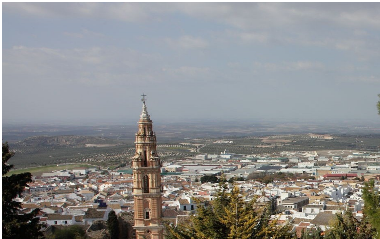
La panorámica tendida hacia el norte desde el cerro de San Cristóbal permite comprender las razones del emplazamiento del recinto defensivo como lugar geoestratégico desde el que se visualiza un vasto territorio que, en la actualidad, está ocupado básicamente por el cultivo del olivar.

Ámbito/s: 39 Campiñas altas. 19 Campiñas de Sevilla. 29 Depresión de Antequera.