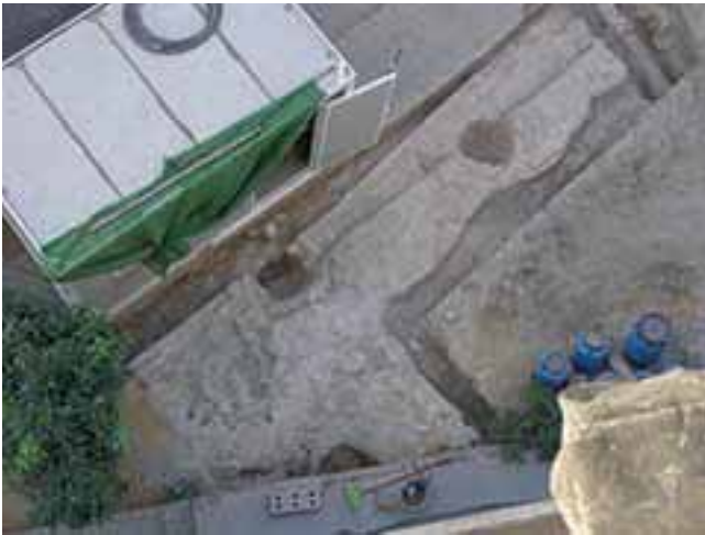
3. CALLE GOLES. TRAMO DE MURALLA TRABADO A UN NUEVO TORREÓN.