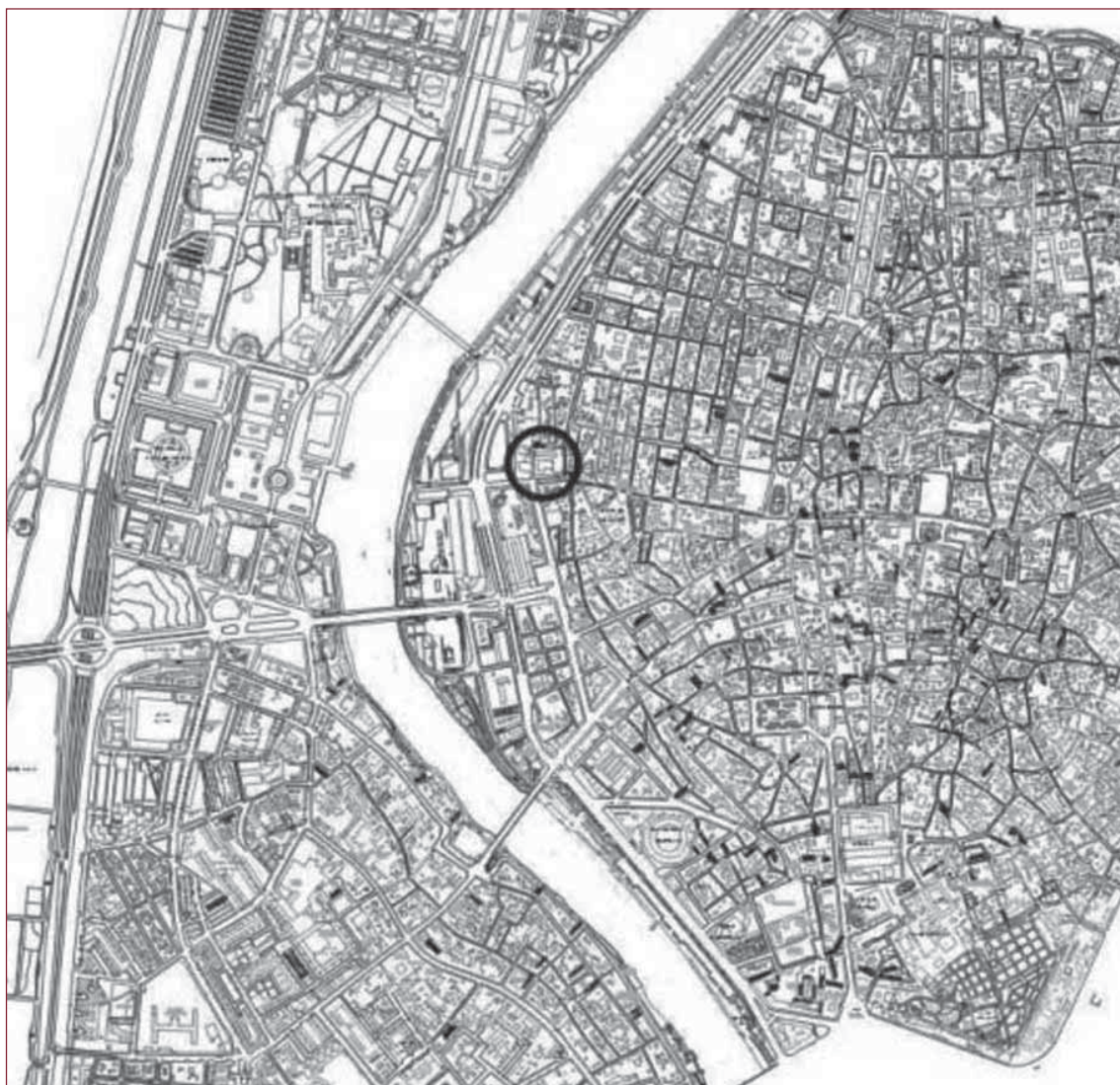
1. LOCALIZACIÓN URBANA Y UBICACIÓN DEL PATIO DE SAN LAUREANO.