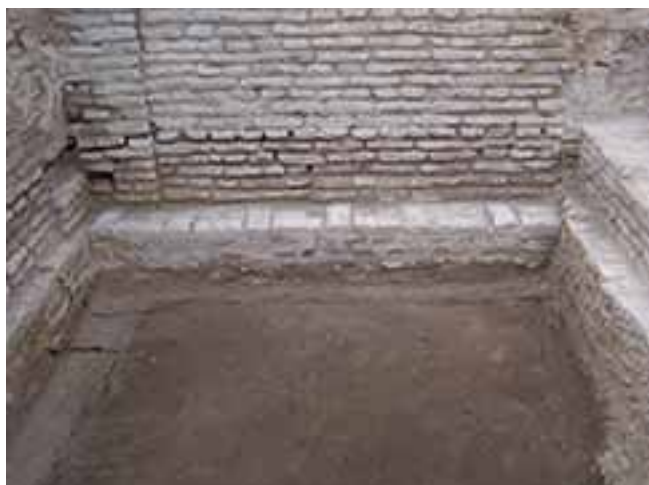
5. MUROS MERCEDARIOS DE LA PRIMITIVA IGLESIA DE SAN LAUREANO SOBRE LAS CIMENTACIONES COLOMBINAS.

Los muros están contruidos completamente de ladrillo. Las fachadas tienen un zócalo realizado con ladrillo reutilizado dispuesto en aparejo a tizón o irregular hasta la altura de la primera hilera de ventanas; a partir de esta cota se emplea material nuevo dispuesto en aparejo inglés a cruz. Los muros interiores se realizan completamente con ladrillo nuevo mientras las cubiertas, incluido el cuerpo de la iglesia, se resuelven con cuchillos españoles mixtos, sobre los que descansan techumbres de teja árabe a dos aguas.