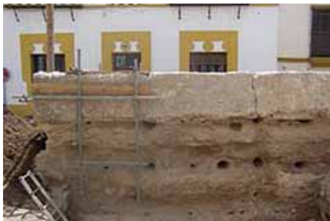
7. LIENZO DE MURALLA EN LA FACHADA A CALLE GOLES.

Goles, siguiendo la muralla por la fachada de los números impares de dicha calle hasta alcanzar el «Jardinico Alto» donde una nueva torre documentada durante las labores de excavación, acoge un pequeño quiebro que alinea el siguiente tramo hasta alcanzar la Puerta Real.