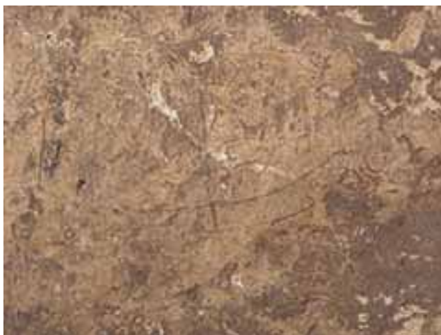
8. GRAFITO DE BARCO SOBRE ENLUCIDO ASOCIADO AL COLEGIO MERCEDARIO.

En 1603 hubo un período de fuertes riadas que tuvo numerosas y desastrosas consecuencias en el barrio de Los Humeros, como el desmoronamiento masivo de las basuras poco compactadas del muladar, lo que provocó la práctica desaparición de la casa de Colón, reconvertida parcialmente en colegio mercedario, quedando tan sólo las trazas de una de las crujías edificadas y las caballerizas, precisamente aquellas