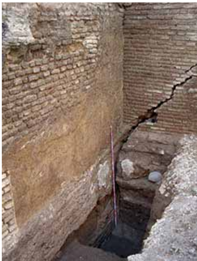
4. DISTINTAS FASES DE CONSTRUCCIÓN Y RECONSTRUCCIÓN DE LA MEDIANERA ORIENTAL DEL COLEGIO MERCEDARIO SOBRE LOS RESTOS DE LA MURALLA.