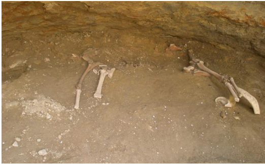
Figura 1- Esqueleto casi completo de un asno en el yacimiento arqueológico islámico "C/ Dos aceras 42-48" en Málaga.