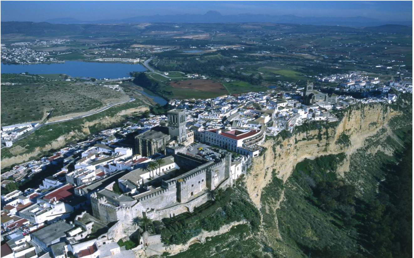
Panorámica de la localidad Arcos de la Frontera sobre el promontorio de paredes verticales con vistas del río Guadalete, el embalse y la campiña.

Poesía de Gerardo Diego en la que hace alusión a las condiciones de ubicación de la localidad de Arcos de la Frontera sobre una pared rocosa de gran altura para su defensa y vigilancia del territorio.