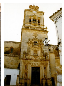
Emplazamiento del Conjunto Histórico de Arcos de la Frontera y un segmento del perfil urbano. Ejemplos de la arquitectura monumental defensiva, religiosa y civil que conserva la población.