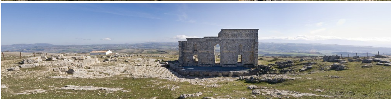
Panorámica del territorio circundante al promontorio sobre el que se encuentra el yacimiento y parte de éste con los restos del teatro.