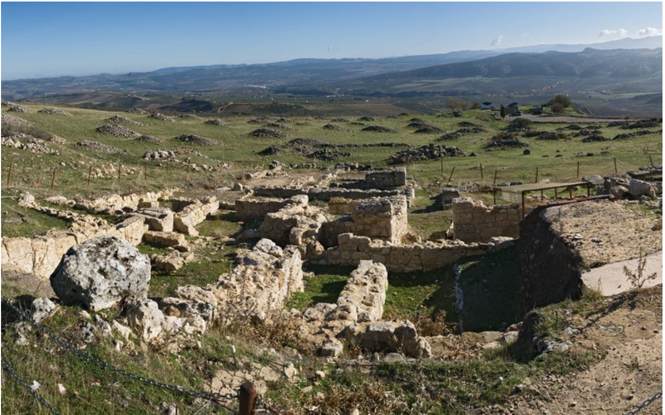
Restos de edificaciones romanas y majanos realizados con piedra de acarreo en la meseta de Acinipo.

Ámbito/s: 21 Depresión de Ronda; 35 Piedemonte subbético.