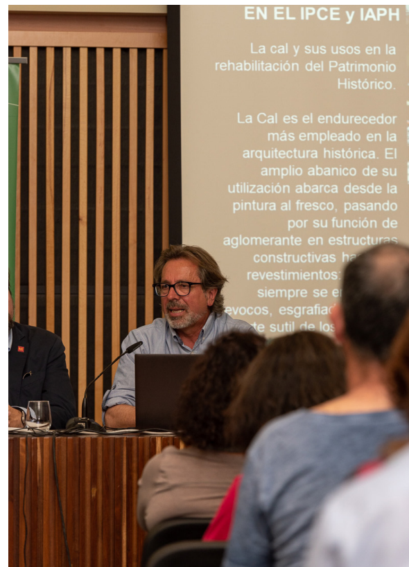
Asociación Cultural Hornos de la Cal de Morón, Sevilla. Manuel Gil. Fondo gráfico IAPH (JoseManuel Santos Madrid)

La coordinadora de la mesa, Gema Carrera resume los principales puntos de interés planteados en la mesa y da la palabra a algunas intervenciones de los asistentes.