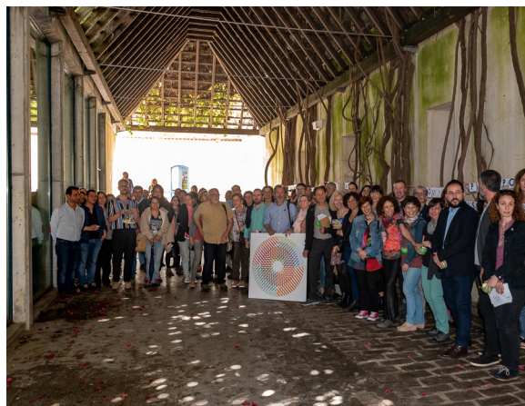
Semillas redactívate.

Isabel Luque Ceballos, IAPH + redactívate