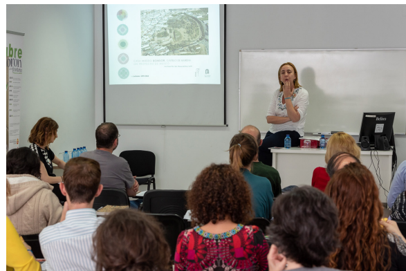
Casa museo Bonsor. Castillo de Mairena del Alcor, Sevilla.