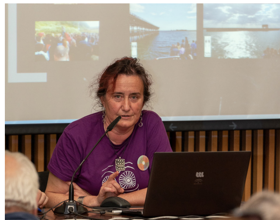
Plataforma ciudadana. Huelva.

Para el futuro están trabajando en la defensa de los cabezos de Huelva amenazados por el urbanismo y la construcción. Medio Ambiente dice que no tienen valor paisajístico. Reclaman que los cabezos no sólo sean BIC sino también monumentos naturales de Andalucía. Para ello quieren participar en la toma de decisiones sobre el paisaje cultural.