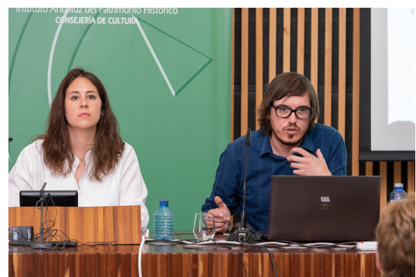
4ª Sesión de presentación de experiencias. Proyección de futuro y viabilidad.

El proyecto se ha desarrollado en varias fases. En la primera, y tras el rechazo por parte de las editoriales de publicar el catálogo, se inició una campaña de micromecenazgo (crowdfunding) que ha permitido su publicación. En la siguiente fase del proyecto, se llevan las imágenes de los cuadros a las aulas, donde los niños seleccionan aquellos que más les han emocionado, y, posteriormente, los escolares van al Museo en busca de