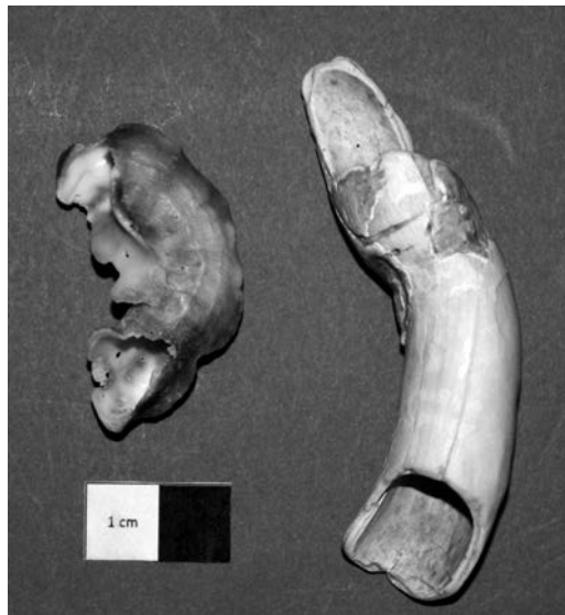
Fig. 2. En esta imagen se puede apreciar la diversidad de formas de los ejemplares de esta familia en dos ejemplares de Serpulorbis arenaria (Linnaeus 1758) recolectados en la playa de “El Espigón” (Huelva)