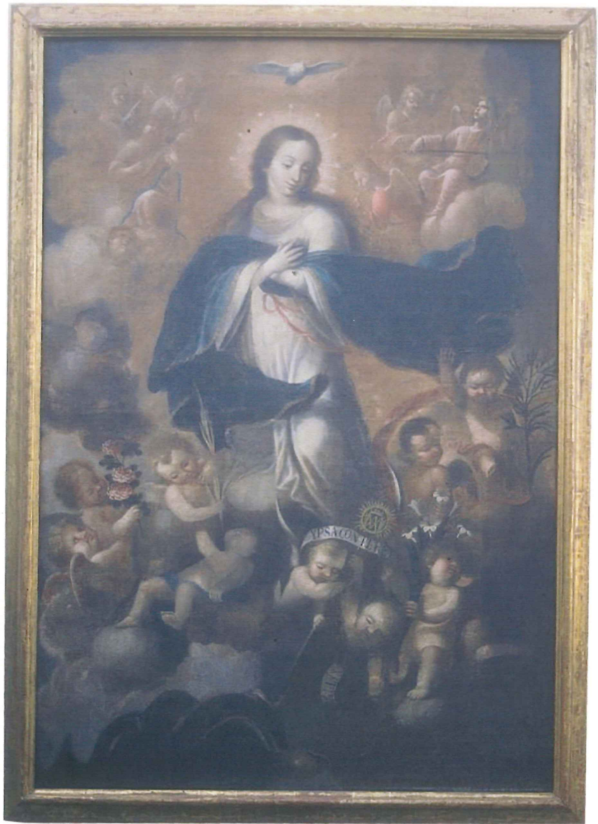
TOMA GENERAL DEL CUADRO.