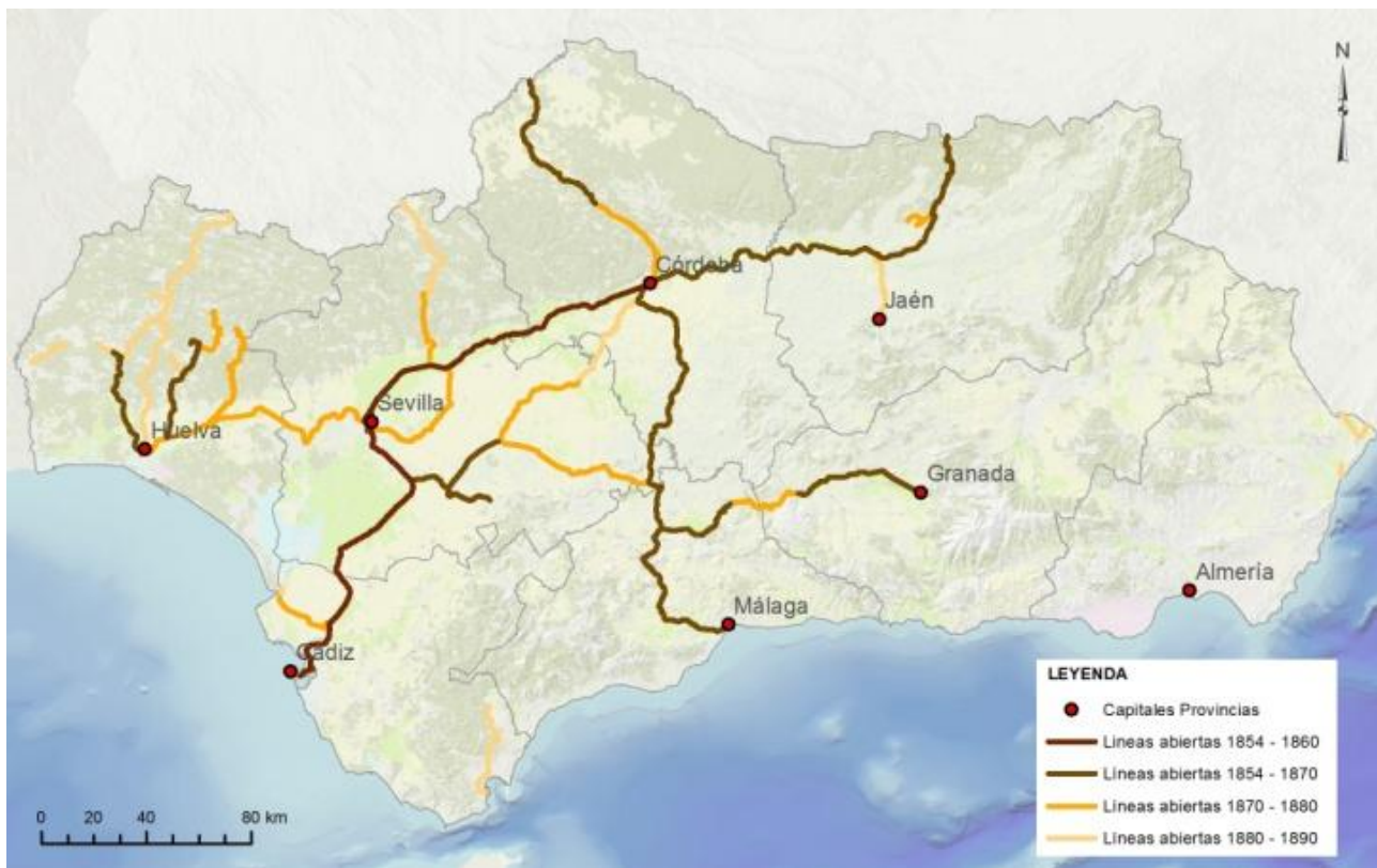
Fig. 5. Mapa de los tramos ferroviarios abiertos hasta 1890. Cerca de 1.960 km de vías en funcionamiento. El mapa representa la primera década del llamado “segundo impulso ferroviario” (1880-1941). Véase el desarrollo de las líneas en el Valle del Guadalquivir y en los accesos a las capitales de la zona occidental de Andalucía. Destacándose un relevante aumento de vías en la provincia de Huelva con los ferrocarriles mineros y el comienzo del tendido ferroviario en el noreste de la provincia de Almería.