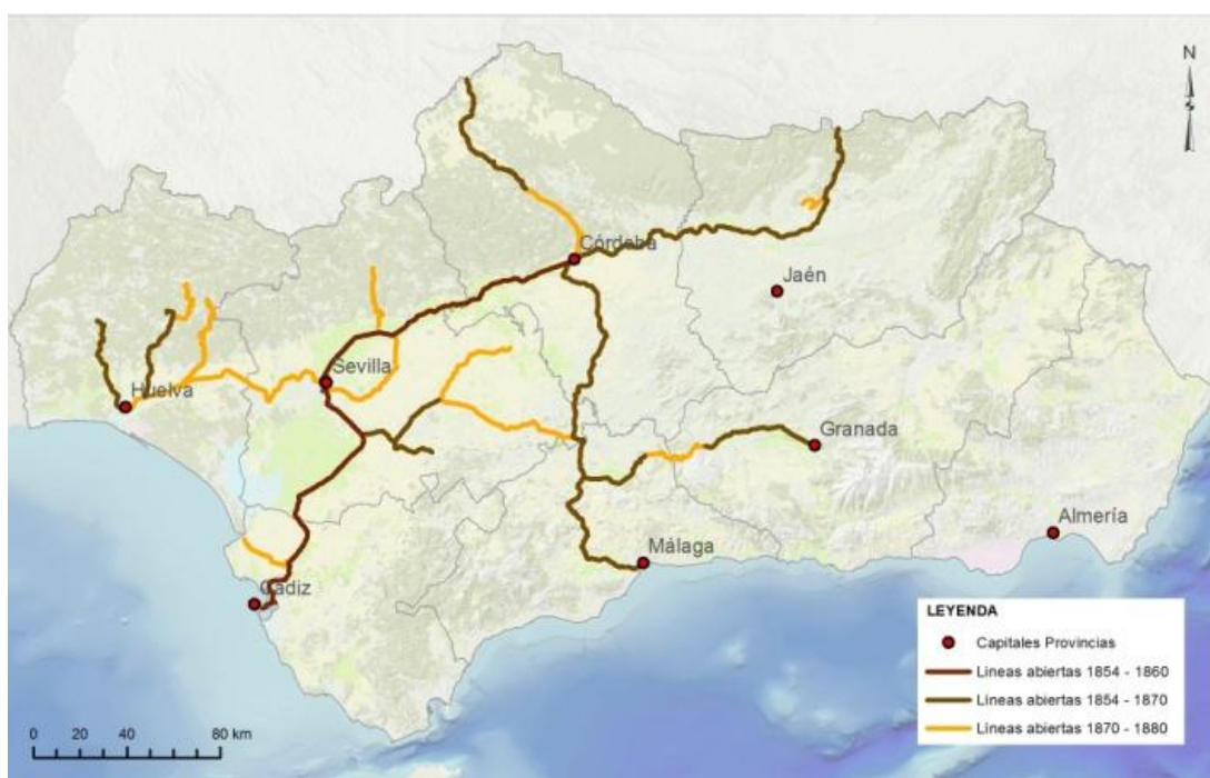
Fig. 4. Líneas de ferrocarril abiertas hasta 1880. Cerca de 1.545 km de vías en funcionamiento. Periodo conocido como “primero impulso ferroviario” (1854-1880). Se configura una relevante red ferroviaria motivada por tres “intereses” y/o “ejes” principales: [Málaga - Córdoba - Despeñaperros] daba continuidad a los tráficos hasta Madrid; el Ferrocarril del Valle del Guadalquivir y su extensión hasta la provincia de Huelva - minera y portuaria; y las líneas para el transporte interior de los productos agrarios y abastecimiento urbano. En la imagen se aprecia el considerable incremento de vías que han tenido las provincias de Huelva y Sevilla.