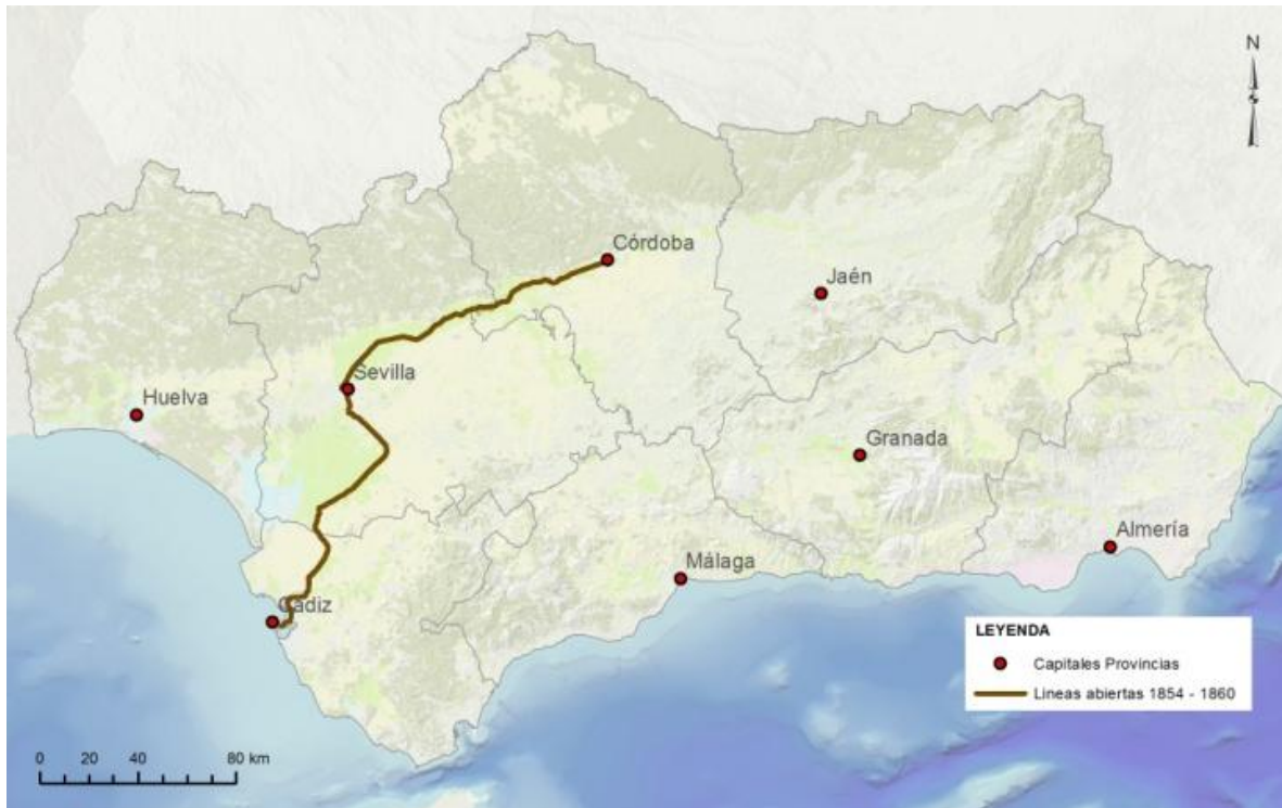
Fig. 2. Líneas de ferrocarril abiertas hasta 1860 en Andalucía. Cerca de 260 km de vías.

El resultado es la creación de una base de datos geográfica digital del proceso del sistema ferroviario histórico andaluz - "rizoma ferroviario" - un espacio hipercomplejo, intervenido y conformado por una gran diversidad de actores. Por un lado se ha realizado un trabajo de registro del patrimonio ferroviario a través de la creación de la IDE que facilitará el trabajo futuro de inventariado. Por otra, este trabajo enseña las vías para la estructuración de la información y sus posibilidades de planteamiento. Así, podemos desarrollar nuevos nodos temáticos y estudiar sus recursos turísticos y culturales, además de aportar herramientas que facilitarán la labor de su mantenimiento y conservación.