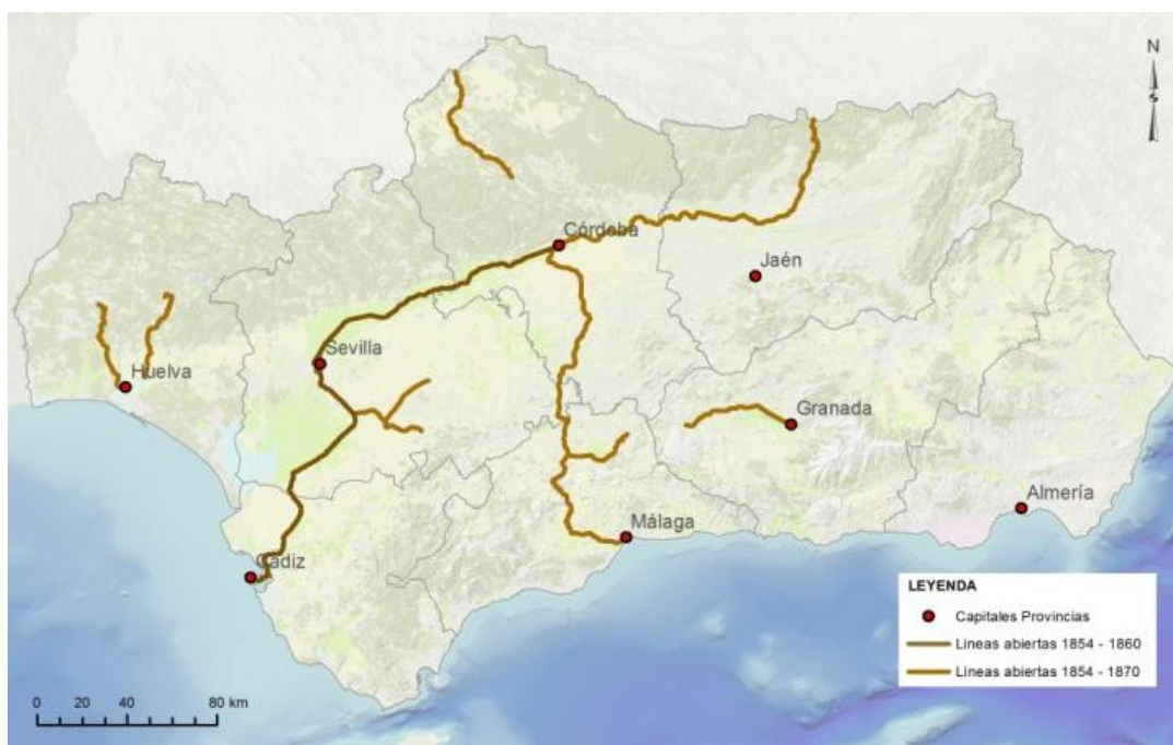
Fig. 3. Líneas de ferrocarril abiertas hasta 1870. Cerca de 985 km de vías en funcionamiento. Se contempla ya la base de la configuración que estructurará el territorio andaluz en el “primero impulso ferroviario”: los ejes mineros perpendiculares a la costa, el eje del Valle del Guadalquivir y las líneas agrarias. Verse el incremento significativo de vías en las provincias de Jaén, Málaga y Córdoba.