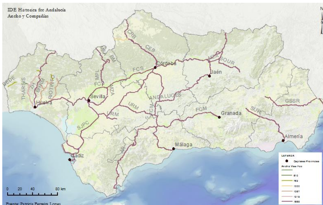
Fig. 7. Mapa con la visualización de los distintos anchos de vías férreas y sus compañías hasta 1895.