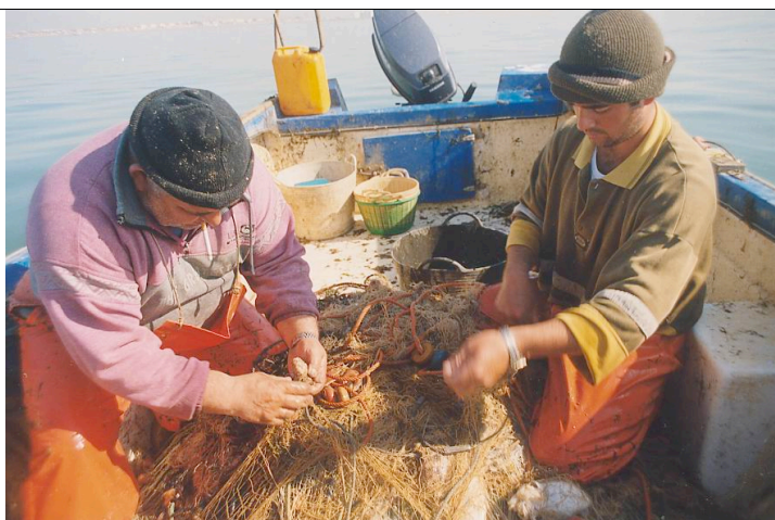
Imagen Identificativa (metadatos)