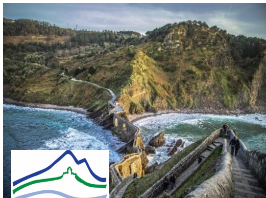
EUROPEAN LANDSCAPE CONVENTION CONVENTION EUROPÉENNE DU PAYSAGE COUNCIL OF EUROPE/CONSEIL DE L'EUROPE