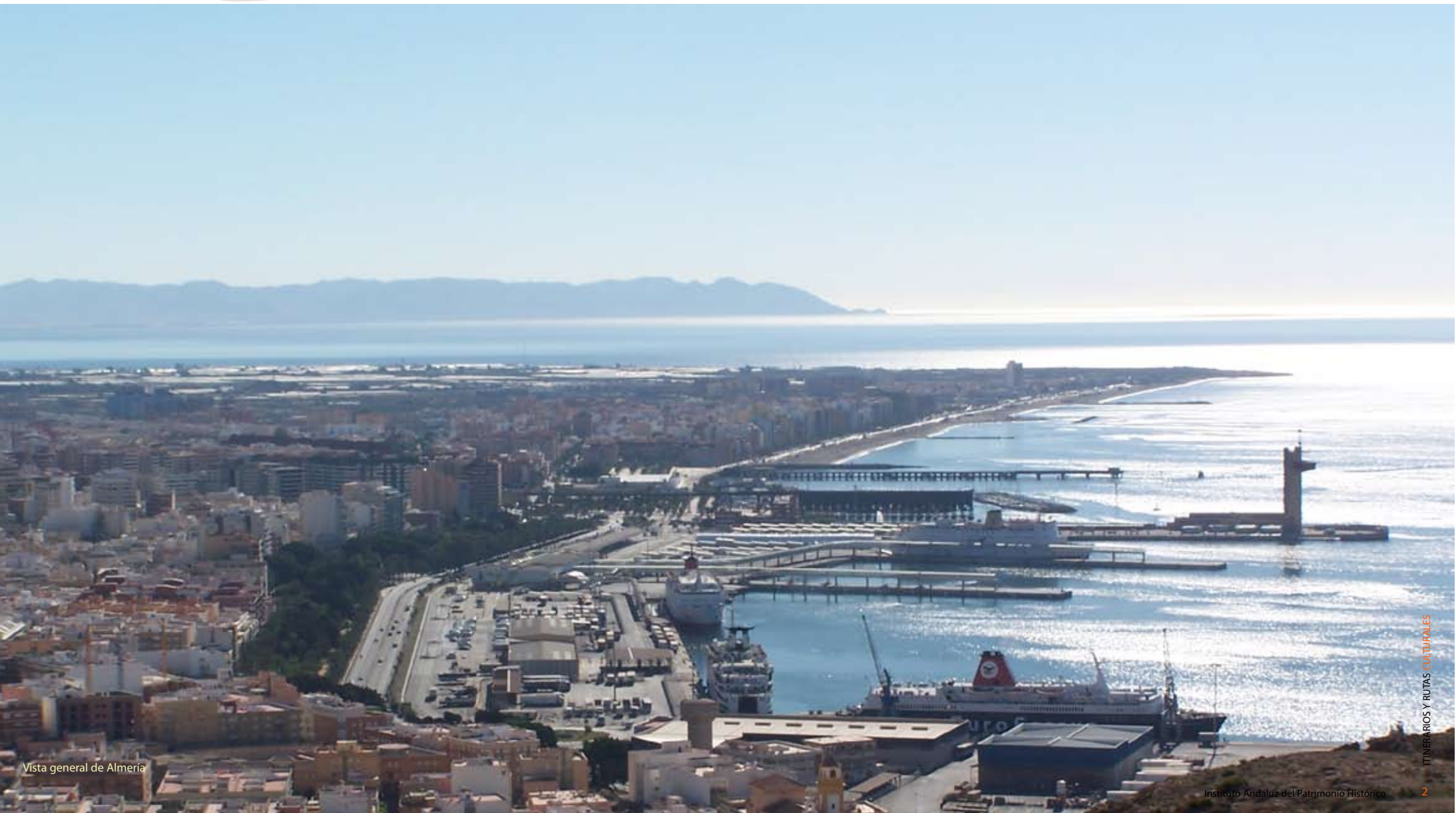
Vista general de Almería