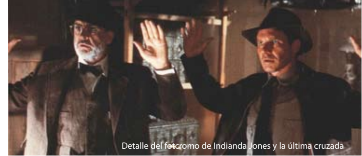
Detalle del fotograma de Indiana Jones y la última cruzada