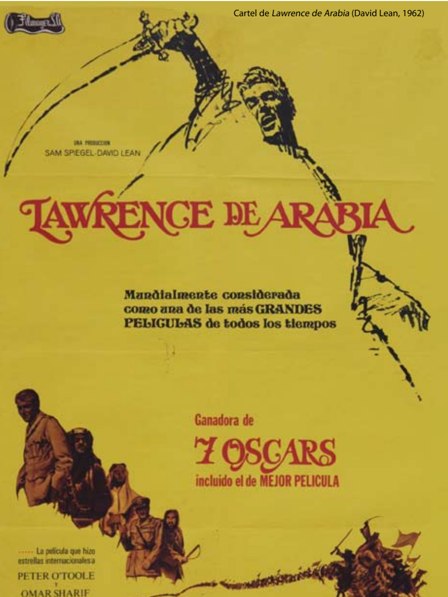
Cartel de Lawrence de Arabia (David Lean, 1962)

plementan con la luz y el mar Mediterráneo.