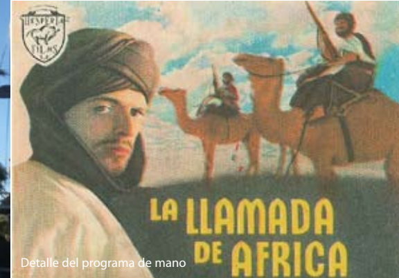
Detalle del programa de mano