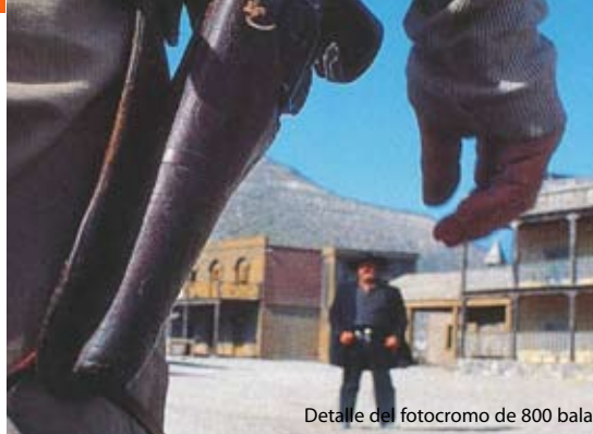
Detalle del fotocromo de 800 balas