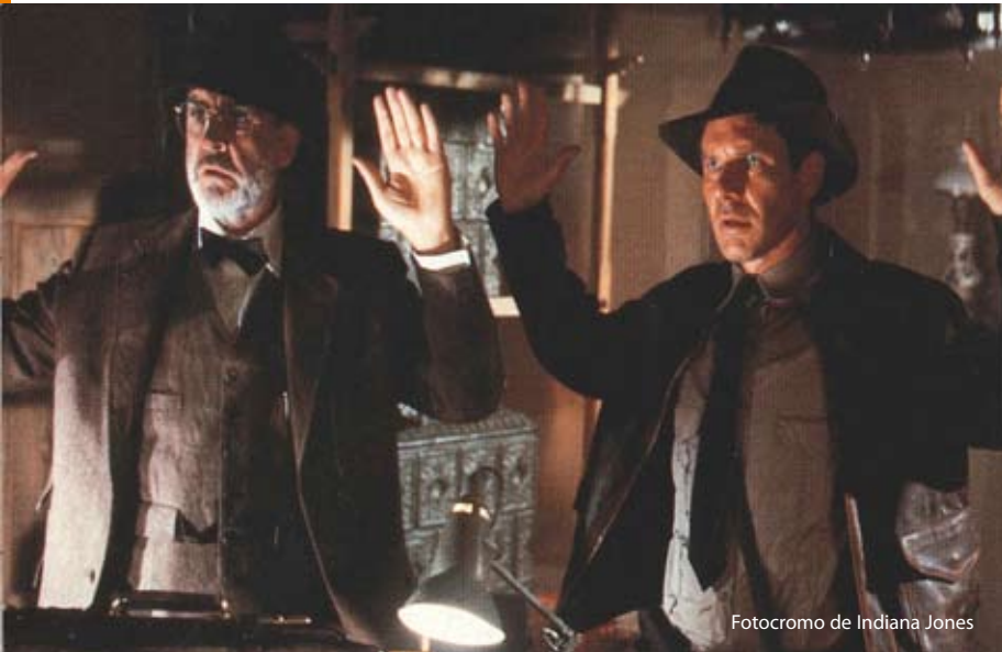
Fotocromo de Indiana Jones