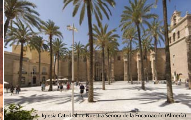
Iglesia Catedral de Nuestra Señora de la Encarnación (Almería)