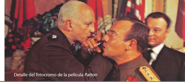
Detalle del fotograma de la película Patton