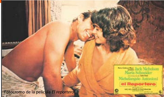
Fotocromo de la película El reportero

En la época dorada del cine en Almería trabajaron casi todas las estrellas de Hollywood: Sean Connery, Charlton Heston, Yul Brynner, Peter O'Toole, Omar Sharif, Alain Delon, Lee Van Cleef, Charles Bronson, Claudia Cardinale, Brigitte Bardot... y también John Lennon como nos recordó la película triunfadora en los Goya de 2014, Vivir es fácil con los ojos cerrados , de David Trueba.