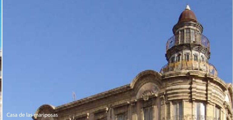
Casa de las mariposas