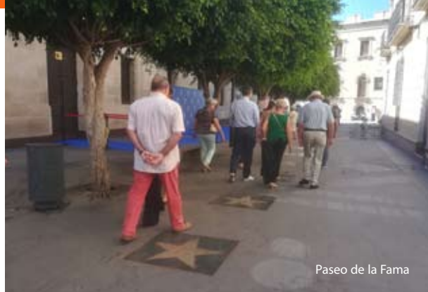
Paseo de la Fama

"Esta estrella debe servir para recordar el pasado del cine en Almería. Aquí se han rodado películas que han cambiado la historia del cine. Debemos contárselo a todo el mundo" (Álex de la Iglesia, director. ABC, 17 de noviembre de 2017)