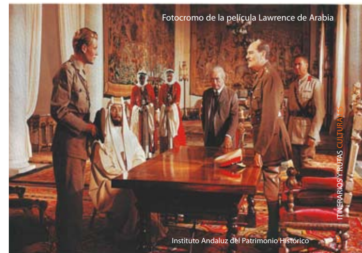
Fotograma de la película Lawrence de Arabia

■ AA.VV. (2011) Guías de Almería. Territorio, cultura y arte . Almería: Instituto de Estudios Almerienses