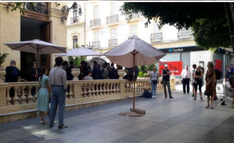
Rodaje de Sonja, Queen of ice , en el Paseo de la Fama, 2017