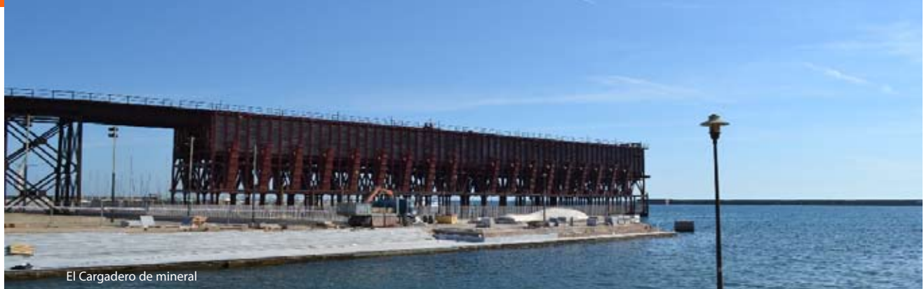
El Cargadero de mineral

"Cuando rodaron Patton fue un gran acontecimiento ... los vecinos disfrutaban de un hecho sin precedentes: por primera vez una película con toda su tramoya se mezclaba con la gente como si formara parte del barrio" (Eduardo Pino, La Voz de Almería , 27 de marzo de 2015).