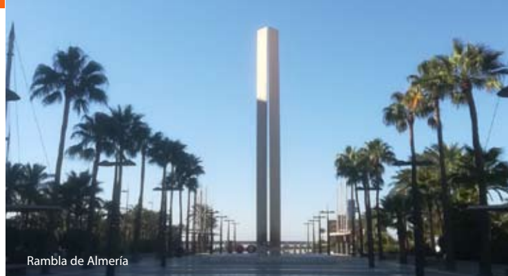
Rambla de Almería

"No divertirse cuando uno puede, es el mayor pecado del mundo" (Sancho Gracia, 800 balas, 2002)