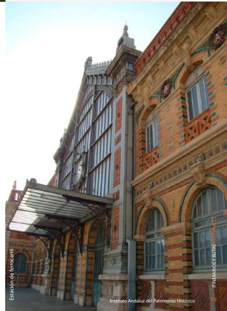
Estación de ferrocarril

Instituto Andaluz del Patrimonio Histórico Camino de los Descubrimientos, s/n 41092 - Sevilla Tel. 955037000 | Fax 955037001 www.iaph.es informacion.iaph@juntadeandalucia.es