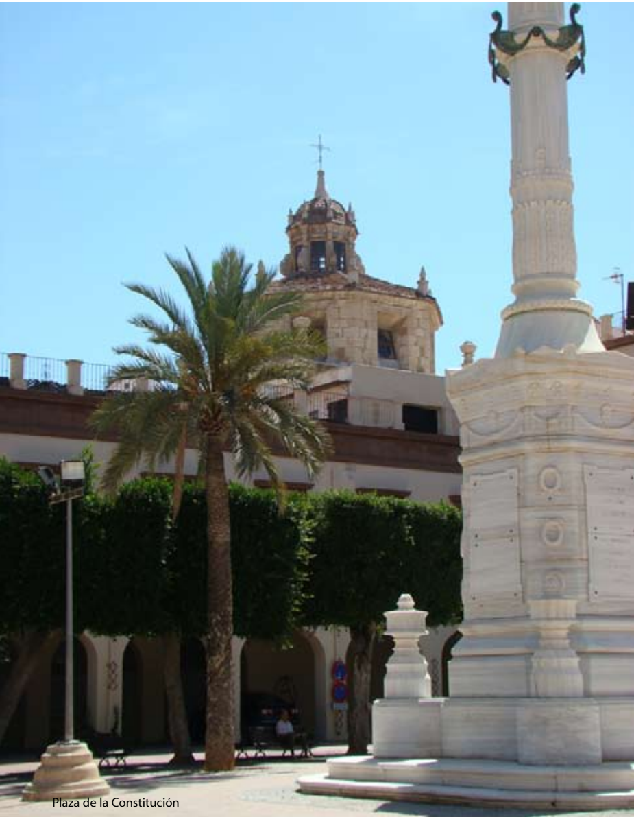
Plaza de la Constitución

hechos reales acaecidos en Argel en el año 1904 cuando un grupo bereber secuestró a una viuda norteamericana para pedir un rescate, desencadenando un grave conflicto diplomático; 800 Balas (2002) obra de Alex de la Iglesia quien, además de usar los decorados del Oeste de Tabernas, rodó en la Rambla y el Parque Nicolás Salmerón de la capital con un elenco de actores encabezado por Sancho Gracia, un film que es todo un homenaje a los especialistas almerienses de los spaguettis westerns de los años 60; y, finalmente, Sonja, Queen of Ice , una producción noruega del año 2017 que narra la biografía de una patinadora de este país nórdico que tras su brillante carrera deportiva se convirtió en estrella de Hollywood.