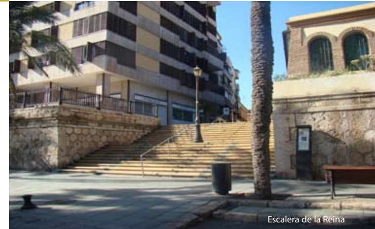
Escalera de la Reina