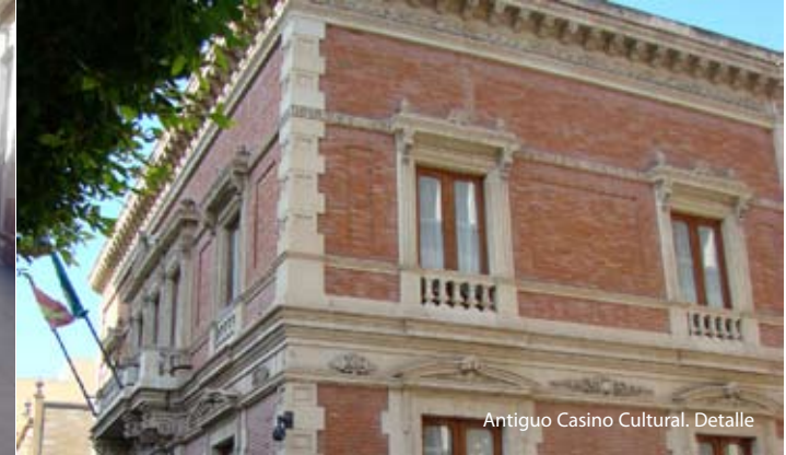
Antigo Casino Cultural. Detalle