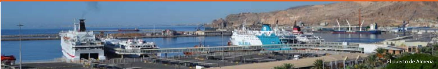
El puerto de Almería

"Todo ha sido verdad aunque pasó en el tiempo... sagrado afán de luz que se expande en el tiempo para "llenarlo todo de sentido" (Pedro Sevilla)