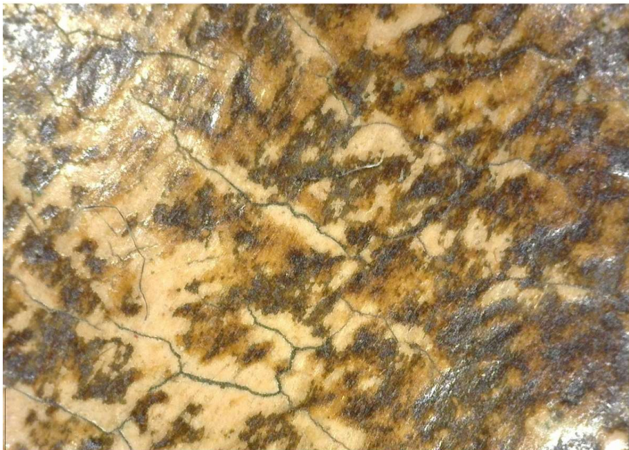
Fig. 3. Fotografía realizada con microscopio digital a 50 x. Detalle de la carnación. Se observa la capa de policromía con un barniz oscurecido sobre ella. Las zonas más claras se corresponden con el color de la policromía original y las más oscuras con el barniz.