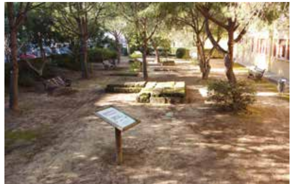
Jardin arqueologico IES Jorge Juan. San Fernando

3º Cómo alcanzar el retorno social y la relevancia para la población local. Mediante la accesibilidad y la integración. Proyectos cercanos que no localistas. Iniciativas intergeneracionales que fomenten la apropiación emocional. Visibilizando los logros y el patrimonio en la microeconomía social, una vez