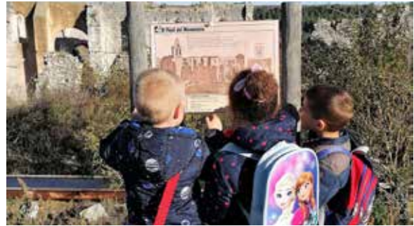
El calabacón errante, educación y patrimonio