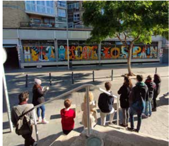
Explicando Arte-Urbano, StreetArt

De las conclusiones extraídas durante esta intensa jornada virtual se pueden destacar que los límites del patrimonio se han quedado pequeños y es necesario reformularlos para ligarlos a la comunidad, a las emociones, a la educación como aliada y de forma integral. Confirmamos que es necesario buscar formas de gestión relacional, de tejer redes y de extender el conocimiento de las buenas prácticas porque aún queda mucho camino por recorrer, mucho trabajo por hacer para llegar a la gobernanza, muchas mentalidades por abrir para compartir creatividad y memoria, para construir caminos que hagan visibles los patrimonios ocultos, los discursos silenciados y diferentes de los establecidos, de lo meramente turístico.