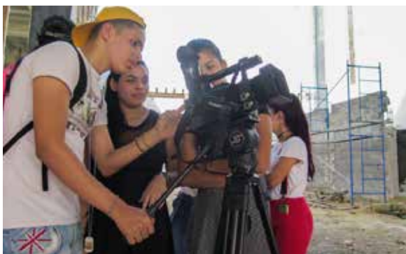
Centro para la interpretación de las relaciones culturales Cuba-Europa