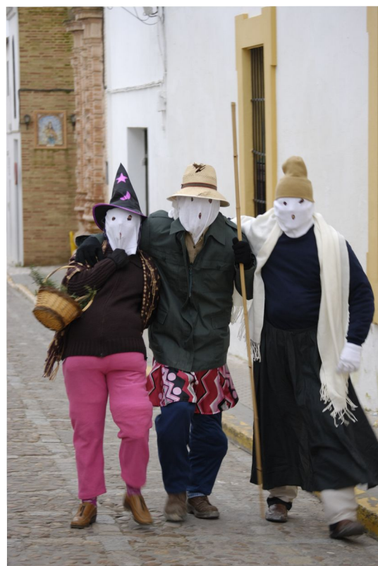
El Carnaval en la Guía Digital del Patrimonio Cultural de Andalucía