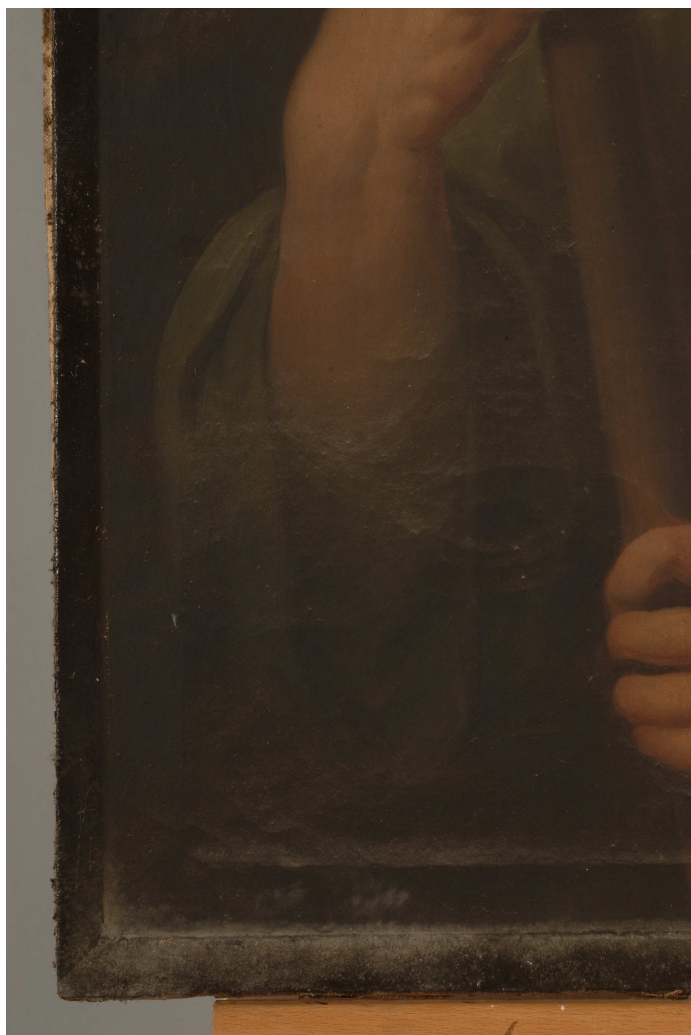
Craquelados y marcado de bastidor.