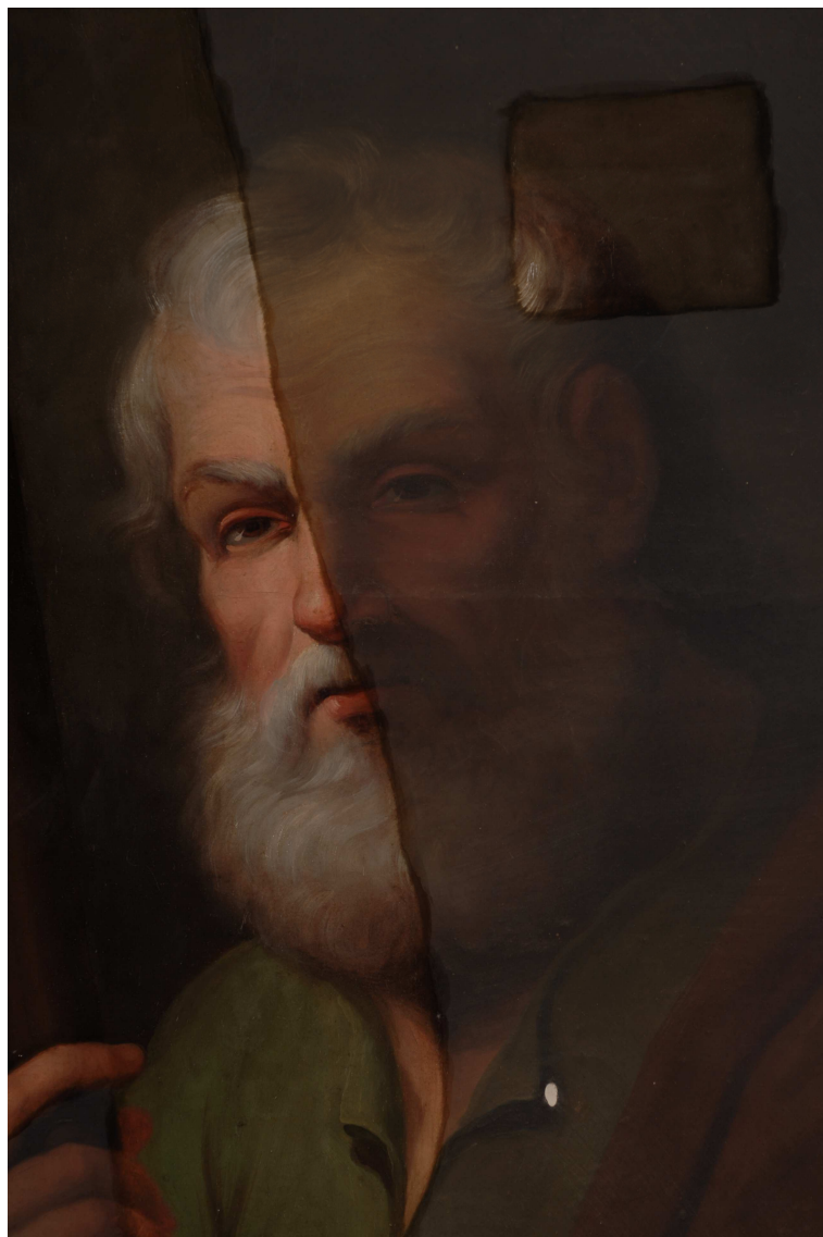
Fotografía proceso limpieza.