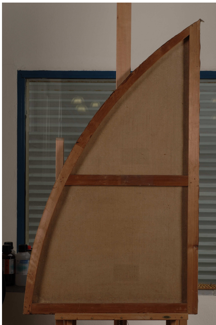
Limpieza del bastidor.