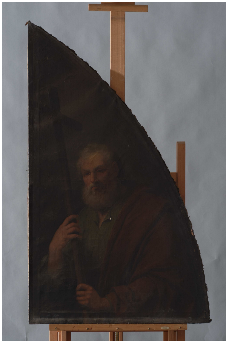
Destensados y suciedad acumulada.