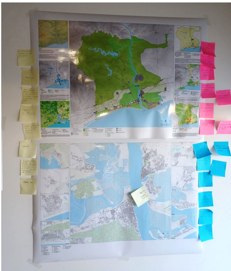
Focus Group 3.