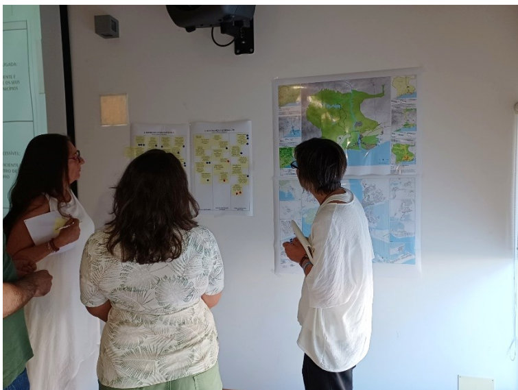
Focus Group 3.