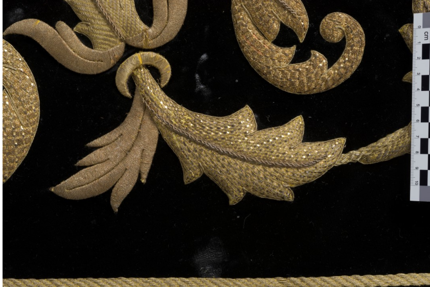
Restos de cera