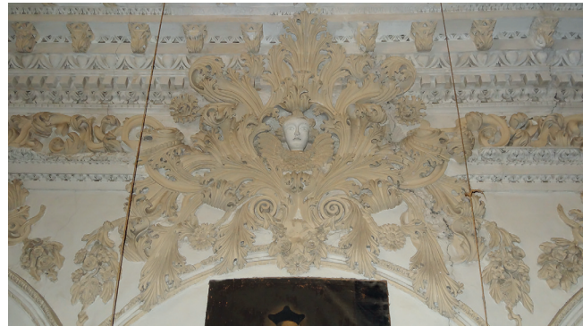
DETALLE DE LAS YESERÍAS QUE RECORREN EL INTERIOR DEL TEMPLO.

las instrucciones al obispo de Málaga don José Franquís Laso de Castilla. A partir de este momento las juntas de temporalidades provinciales y locales se aseguraron de que todos los bienes muebles e inmuebles, urbanos y rurales, fueran inventariados, acompañados de una tasación aproximada de cada uno de ellos. Para su realización se pusieron al frente, en la medida de lo posible, a expertos en la materia a inventariar.