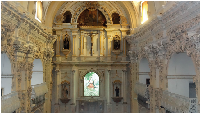
VISTA DEL INTERIOR DE LA IGLESIA HACIA EL RETABLO MAYOR, CON LAS TRIBUNAS Y SU DECORACIÓN EN LOS LATERALES.