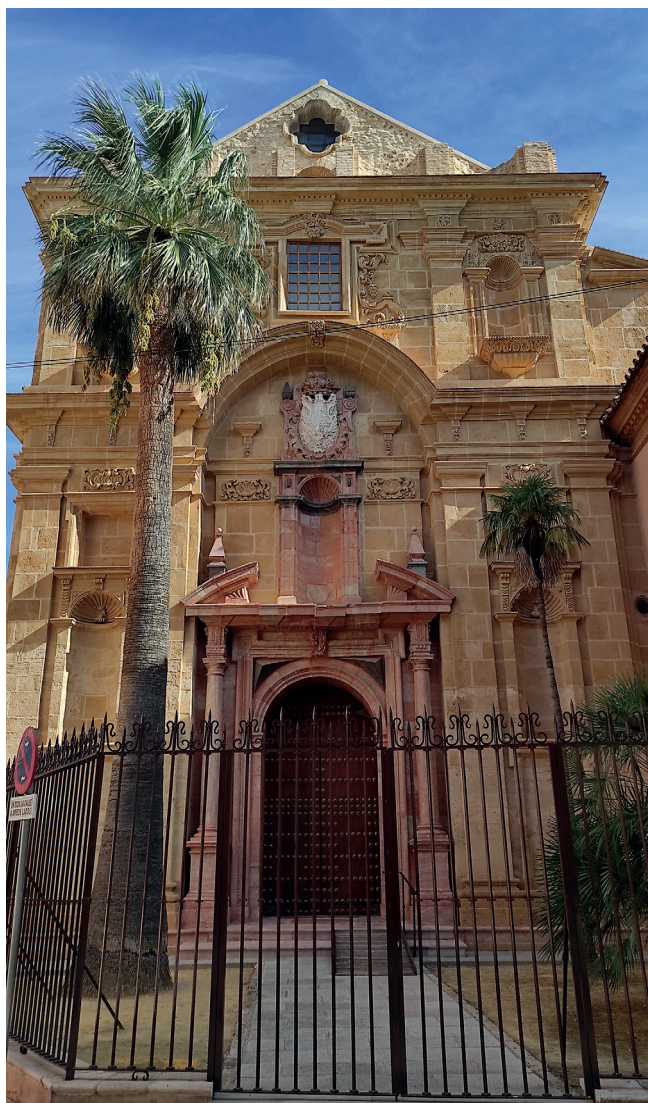
PORTADA DE ACCESO A LA IGLESIA DEL COLEGIO.