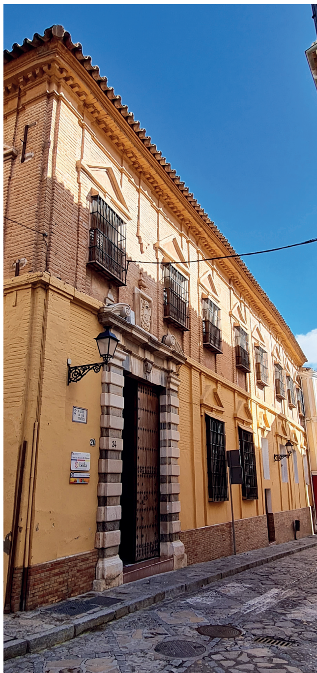
FACHADA Y PORTERÍA DEL ANTIGUO COLEGIO.