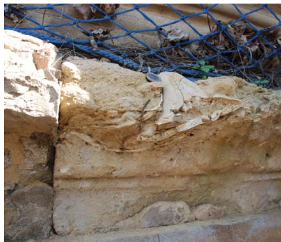
Detalle caliza Portada con macrofósiles (erizos)