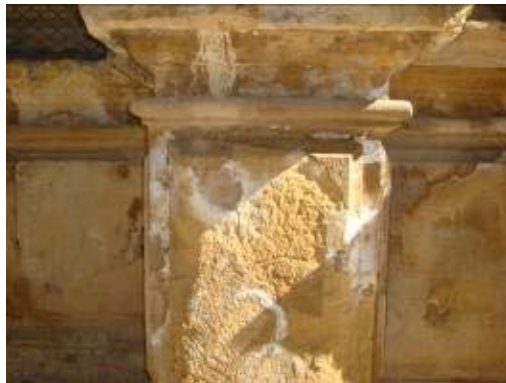
Fig.1 y 2. Pedestales con diversas patologías: arenización, pérdidas de volumen, así como la fuerte presencia de eflorescencias