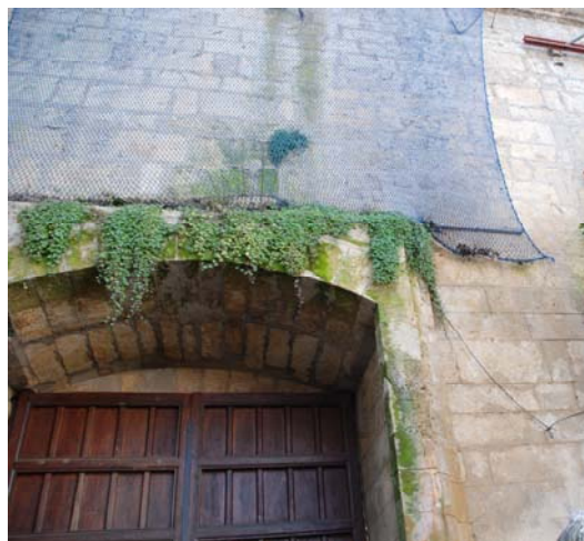
Biocostras y desarrollo de plantas superiores.