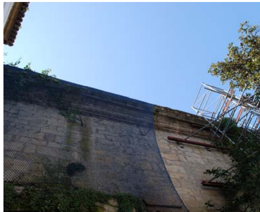
Crecimiento de planta superior de tallo leñoso

En el biodeterioro observado en la zona superior de la portada fundamentalmente abundan líquenes y cianobacterias ya que en esta zona la insolación es mayor. Mientras que en la parte inferior el predominio de clorofíceas (algas verdes) y cianofíceas es mucho mayor causado por la elevada humedad del sustrato.