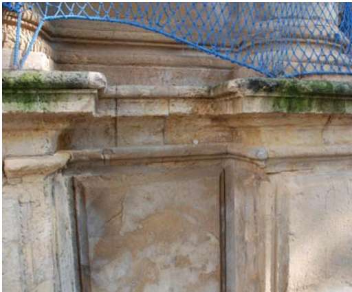
Cianobacterias y algas verdes en cornisa zona inferior