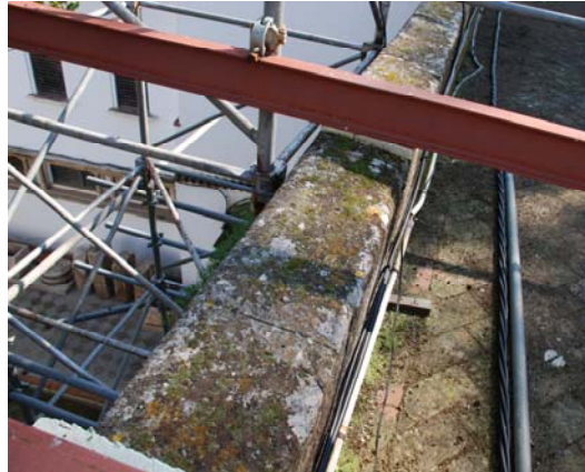
Líquenes y musgos colonizando la zona superior.