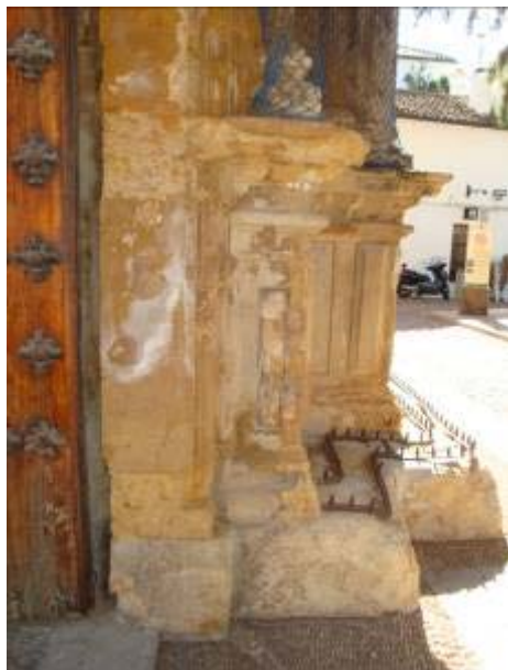
Fig. 3. Detalle de jamba de la puerta con diversas patologías