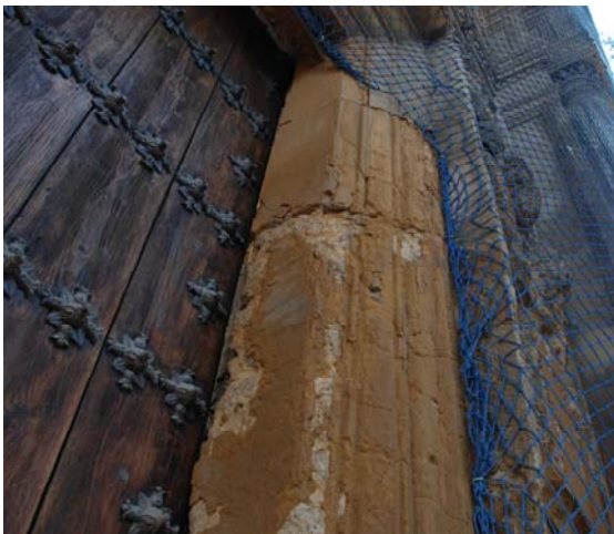
Mortero de principios de S.XX en mal estado

reemplazados en las distintas intervenciones realizadas sobre la portada y el resto de la fachada. Se desconoce si estos se encontrarían en mal estado o fueron reemplazados con la intención de homogeneizar y sanear las llagas en las intervenciones llevadas a cabo.