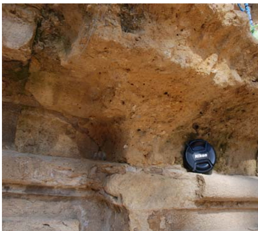
Caliza bioclástica Portada con matriz margosa

Es muy probable que correspondan a una serie afloramientos de materiales biocalcareníicos, de edad Tortoniense, y que se extienden en forma de manchas por todo el borde septentrional del río Guadalquivir en contacto por falla con los materiales Paleozoicos de los relieves más meridionales de Sierra Morena, y al parecer de potencia siempre inferior a los 20 metros (IGME, 1975). Estos materiales corresponden a depósitos de origen marino, y más concretamente a un conjunto de materiales de las denominadas "facies de borde" de origen mixto (detrítico-químico), marino, de facies de plataforma somera (entre la playa y el surf), con relativamente alta influencia continental.