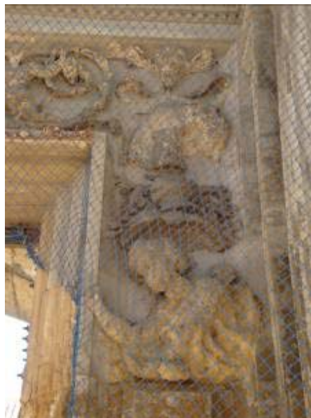
Fig. 4. Detalle del arco de la fachada con fondos recubiertos de cemento