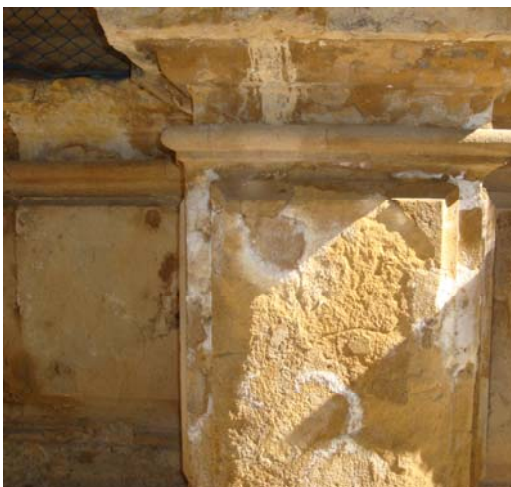
Eflorescencias procedencia desconocida (Spt 2009)

De todos estos materiales de alteración deberán tomarse muestras en las épocas del año en que mejor desarrolladas se encuentren para poder establecer claramente su origen y así establecer de forma clara los factores y mecanismos de alteración.