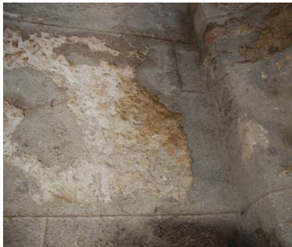
Reparcheos con morteros grises de cemento portland

De los morteros de intervención, se observa un mortero abundantemente utilizado, de coloración ocre anaranjada, y que al parecer corresponde a una intervención realizada a principios del siglo XX. El estado de conservación de este mortero es variable dependiendo de las zonas y de lo expuesto que se haya encontrado a los agentes de alteración externos. En principio por su coloración, parece indicar que se trata de un mortero de cal con alguna pigmentación, pero es recomendable realizar una caracterización exhaustiva del mismo para comprobar que su alteración no se deba en parte a causas intrínsecas al mismo (componentes), y que a su vez pueda haber perjudicado al material pétreo o hacerlo en un futuro.