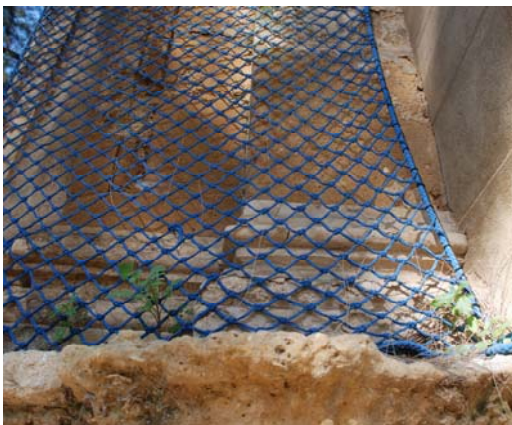
Crecimiento de plantas superiores de pequeño porte