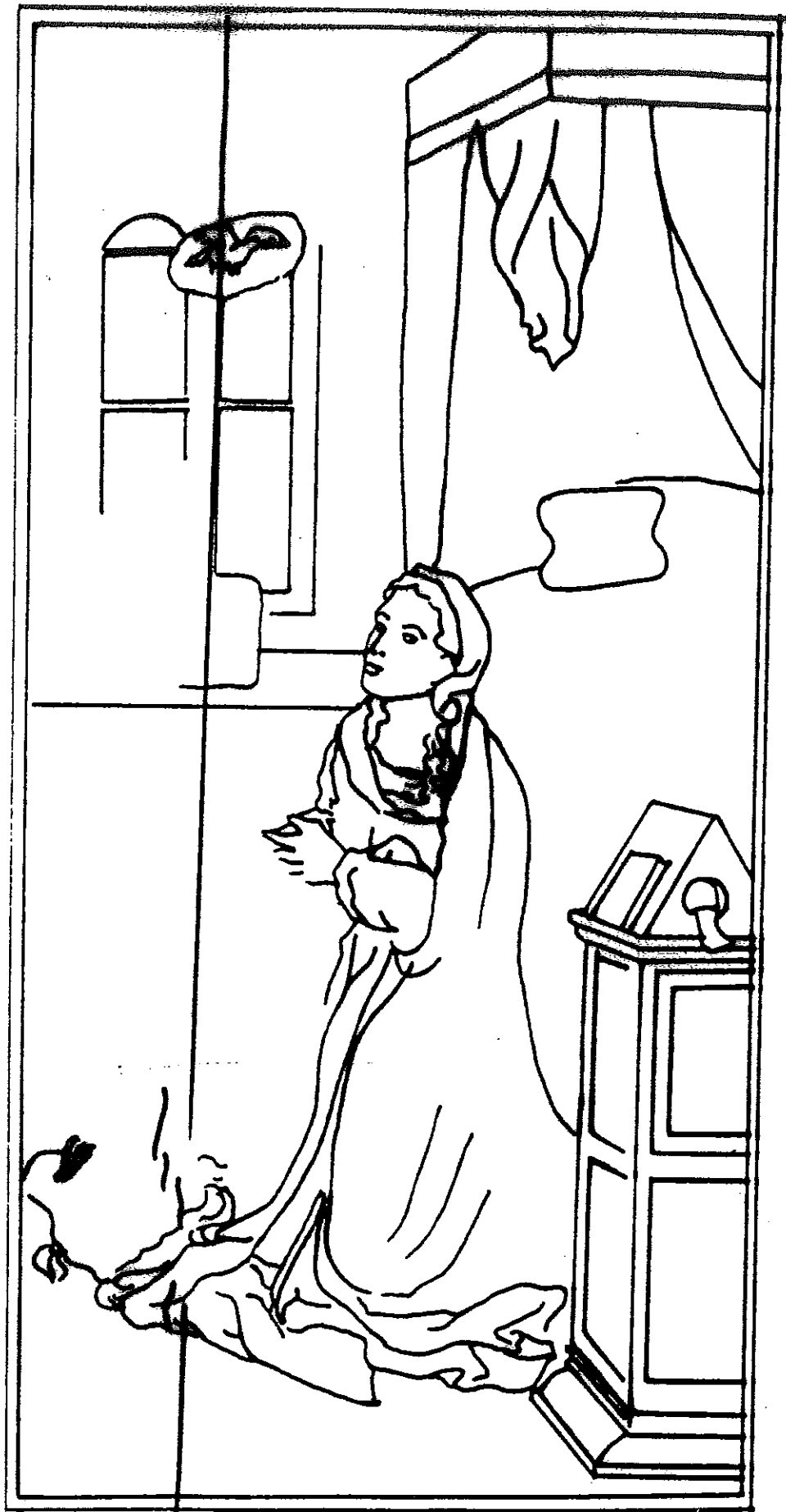
SEPARACION DE PANELES Y GRIETAS