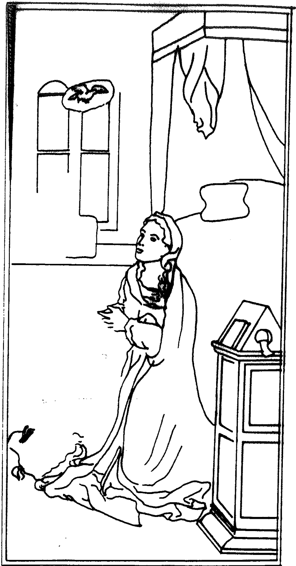
SOPORTE PICTORICO FUERA DEL MARCO CAUSADO POR EL DESPLAZAMIENTO