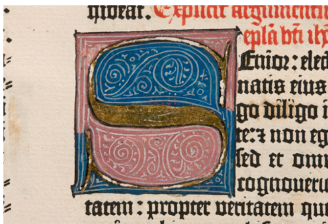
Detalle de la Biblia de Gutenberg de la Universidad de Sevilla