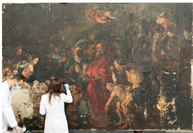
Alumnos en estancia realizan labores en el lienzo de la Adoración de los Reyes Magos de la Universidad de Sevilla

Por otra parte, hay que tener en cuenta que nos encontramos ante un patrimonio singular si atendemos a su régimen de protección. De este modo, la disposición adicional sexta de la Ley 14/2007 de Patrimonio Histórico de Andalucía recoge que los bienes muebles e inmuebles que pertenezcan a las universidades andaluzas y que cuenten con un interés artístico, histórico, arqueológico, etnológico, documental, bibliográfico, científico o industrial, quedan inscritos en el Catálogo General de Patrimonio Histórico de Andalucía como bienes incluidos en el Inventario General de Bienes Muebles del Patrimonio Histórico Español o como bienes de catalo-