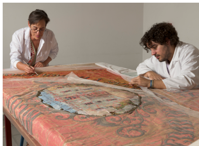
Restauración de la bandera de la Sociedad de Cigarreras y Tabaqueros de la Universidad de Sevilla

ral. En efecto, las instituciones universitarias andaluzas custodian un interesante legado patrimonial que nos permite redescubrir algunos de los principales hitos que las identifican y caracterizan. Sin embargo, el interés de este patrimonio no solo reside en su función como testimonio de las diferentes etapas que convergen en la génesis y desarrollo de estas entidades, sino además en la multiplicidad de valores culturales que conlleva