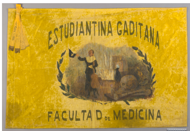
Bandera de la tuna de la Facultad de Medicina de la Universidad de Cádiz

gación general, respectivamente. Por lo que, tal y como indica la legislación vigente, cualquier actuación sobre los bienes de titularidad universitaria requiere de la previa redacción de un proyecto de conservación. Este documento, sin lugar a dudas, contribuye al conocimiento profundo e integral del bien y garantiza la adecuación y el éxito de la intervención propuesta.