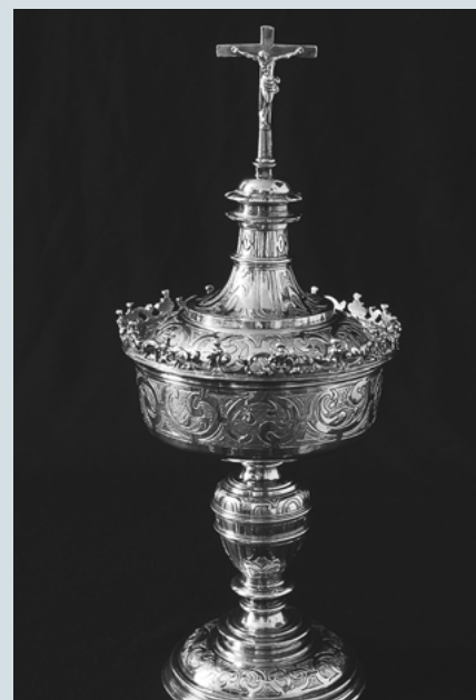
La Zubia (Granada). Iglesia de Nuestra Señora de la Asunción. Copón . Anónimo granadino. 1550-1599.