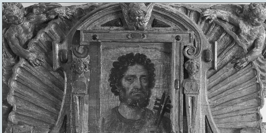
Durcal (Granada). Iglesia de la Inmaculada Concepción. San Pedro . Anónimo español. 1550-1599.

Si analizamos resultados concretos observaremos que se han inventariado, a fines de 1999, 122 inmuebles repartidos por la provincia de Granada con un total de 9.286 bienes. Esta actividad, no obstante, podemos dividirla en dos fases. La primera hasta 1994, año en que el Instituto Andalúz de Patrimonio asumió la completa responsabilidad técnica de la coordinación y, la segunda, hasta la actualidad. En la