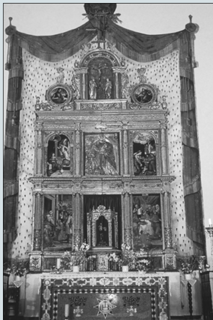
Ogíjares (Granada). Iglesia de Santa Ana. Retablo mayor. Trazas de Juan de Maeda. 1567

primera fase, desde 1989, se habían realizado 5.717 fichas en distintos formatos de los elaborados por el Ministerio de Cultura. A partir de esta fecha (1994) el Instituto Andaluz ha mantenido una doble actividad: la continuidad del proyecto y la informatización y revisión de lo realizado hasta el momento. Concluyendo, en estos momentos, con la totalidad de los bienes informatizados y, por tanto, con la unificación de criterios y soportes.