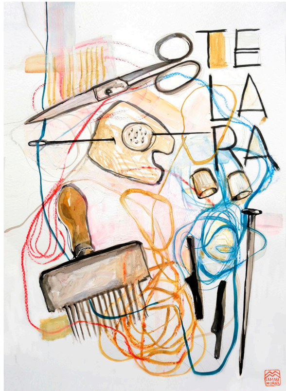
Nudos de las Telaras de la Zubia.

Y hoy, que ya habíamos hilado todo ese hilo, con las telaras hemos seguido la trama de la historia. Estas mujeres del oriente andaluz nos contaban que las telaras han creado el lienzo de sus vidas urdidas con un tejido de mota o nudo turco, tapizando el suelo de cualquier lugar del mundo. De nuevo el mapa, hilando el tiempo desde Andalucía como nuestras abuelas, nuestras madres y nuestras hermanas en un oficio en el que el lujo es el propio tiempo y, en el tejer, “ el tiempo es el tiempo de las manos ”.