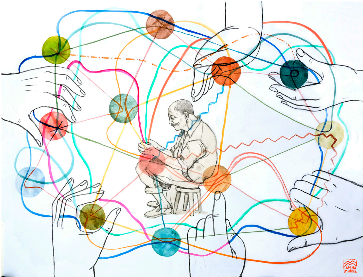
RED. Ilustración: La Mari Muriel