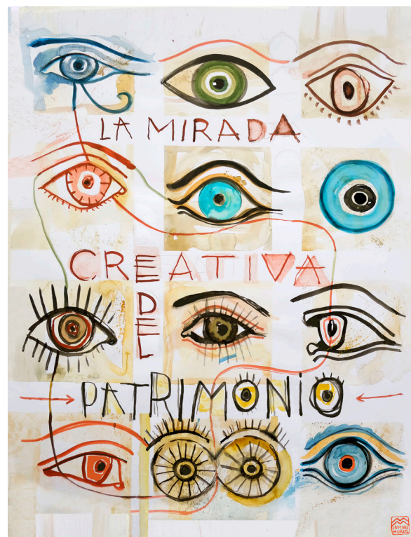
La Mirada Creativa.