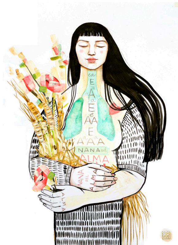
La nana del alma. Ilustración: La Mari Muriel