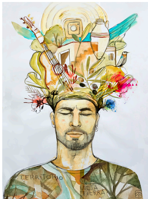
Vieja Tierra.